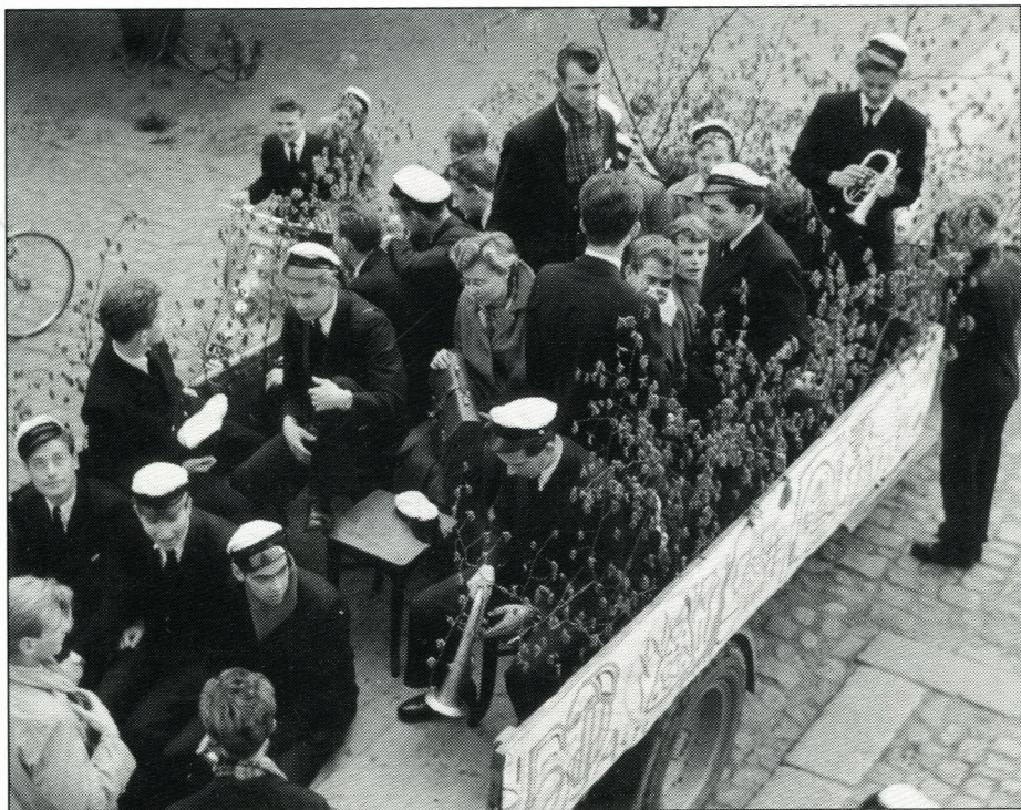
Sidste skoledag 1954! Traditionen tro afhentes lærerne i deres hjem og køres til skolen. Her er der om formiddagen fælles kaffebord og anden hygge i gymnasiets have. Se bagsiden.