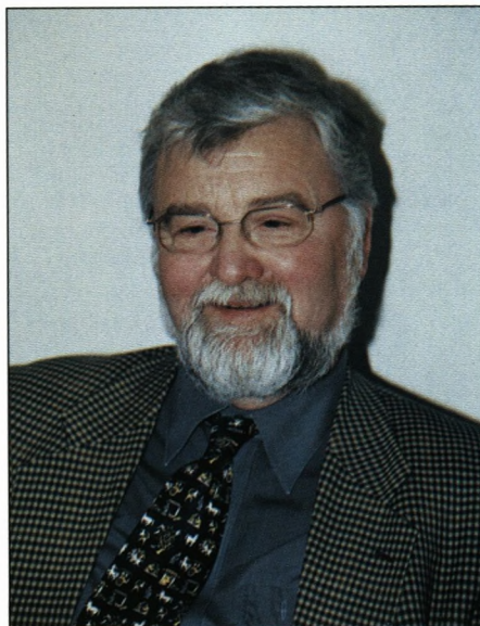
Rektor fortalte om skolens arbejde.

At der i år ikke blev sendt et "Soransk Nyhedsbrev" til netværket skyldes primært, at