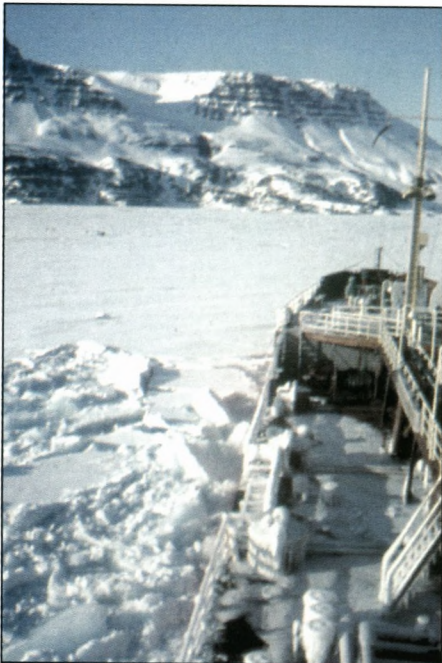
Så går den ikke længere!