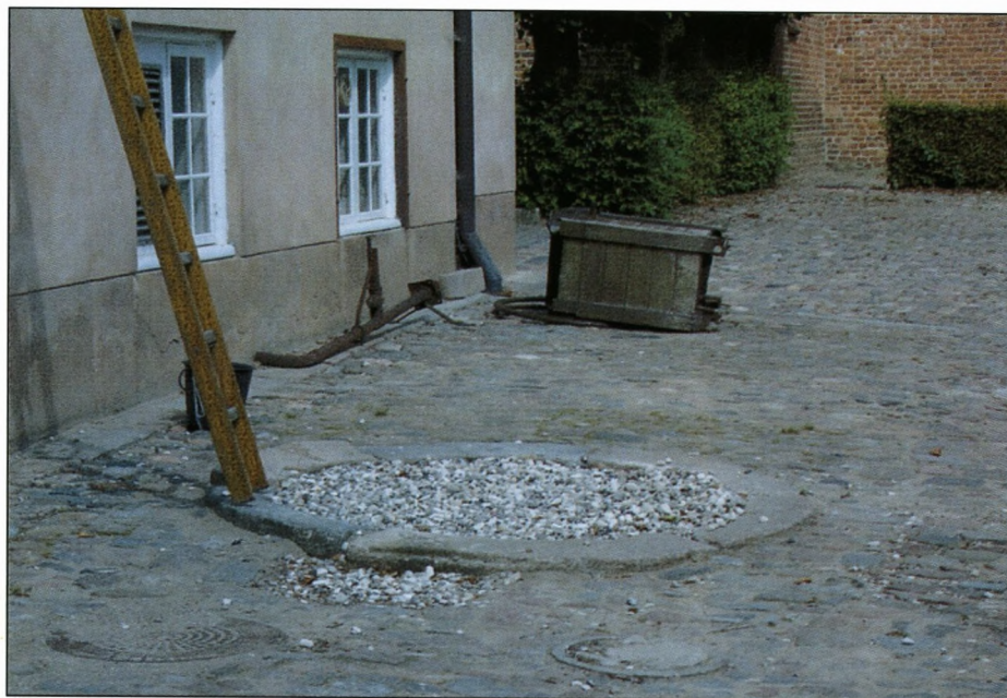
Det måtte jo ske: Pumpen er faldet! Og ærlig talt: pyntede den?

Deadline næste nr. – Den 10. september 2001.