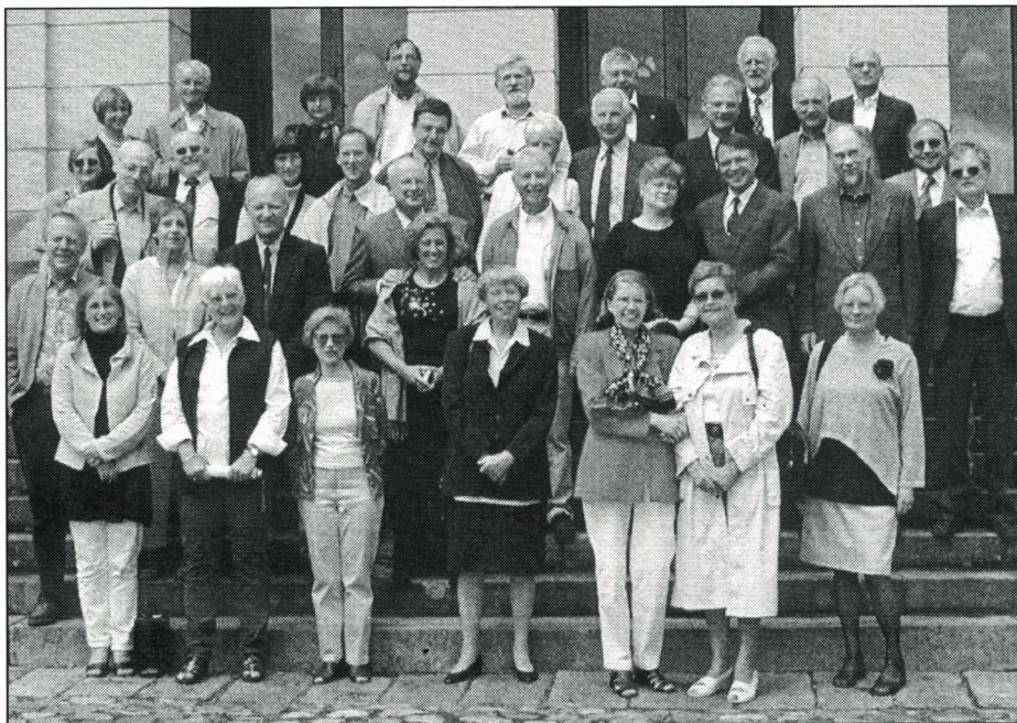
Billedet fra 2001 er i stedet taget fra plænen mod søen.