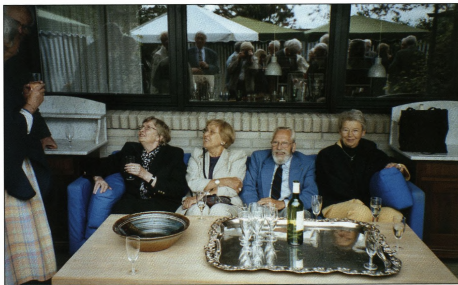
Finn, yndige damer og et spejlbillede af virkeligheden