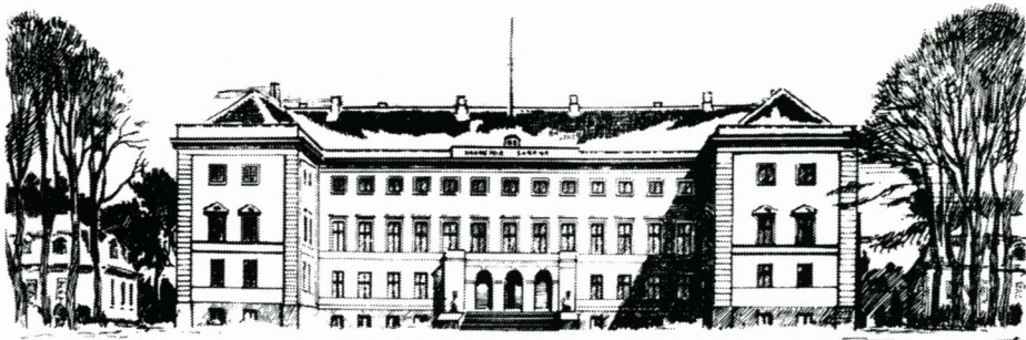
C.W. 1898 Academia Sorana