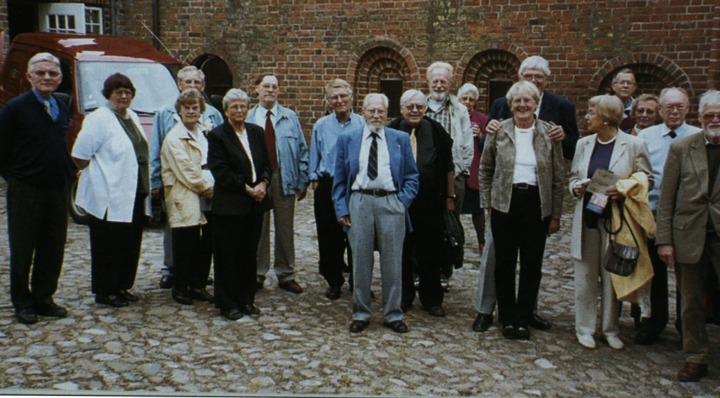
Lidt af den aldrende ungdom.