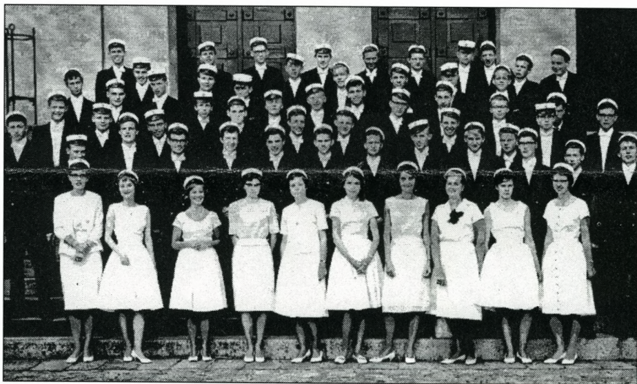
Studenterbilledet fra stentrappen i 1961 bekræftede os i at vi stadig holder os godt.

Lars Kelstrup greb os alle ved sin leven-