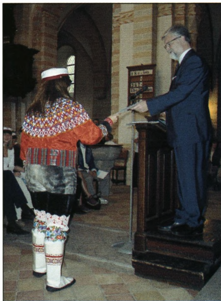
Rektor overrækker eksamensbevis til den flottest klædte studine.

Der er ingen tvivl om, at i betragtning af, at I er en ombejlet generation vil arbejdsgiv-