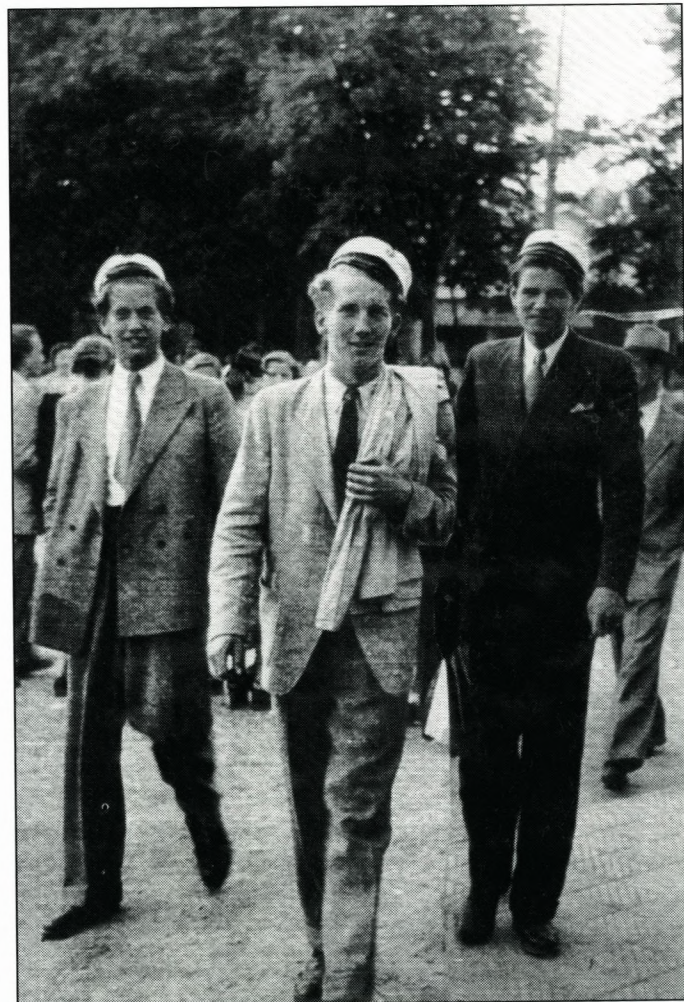
Invitationens forside (Tivoli, juni 1945).

Efter vi blev studenter i 1945 har holdet mødtes i Sorø hvert femte år. Vi samlede en lørdag i forsommeren – tæt på eksamenstiden – for sammen med vores koner og kærester at holde weekend og mindes gamle dage. Der blev spist middag og danset på Parnas og senere på Postgården. Efter morgenmaden gik tiden med ture, snak og frokost i spredt orden. Der har alle årene været stort og feststemt fremmøde.