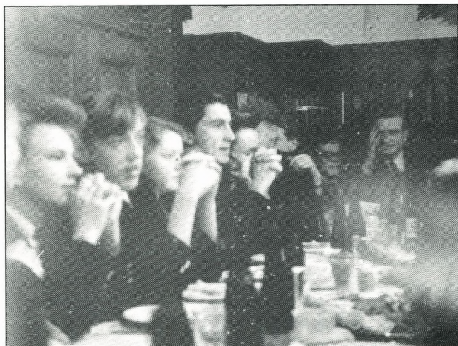
Baldursold 1954. Det er æblemost, der er på bordet!!!