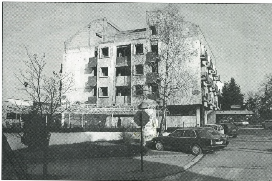
Et hotel med air condition. Se artiklen side 136.

Deadline næste nr. – Den 19. november 2001.