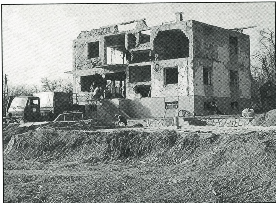
Et sønderskudt hus.

Vi fik forhandlet os frem til, at vi ville etablere en militær bro over åen, således at lastbilerne kunne aflevere deres materialer. Men i mellemtiden regnede det uafbrudt i 4 dage, vandet steg 13 meter og på grund af jordskred længere oppe, kom vandet pludseligt tordnende og ødelagde naboens bro.