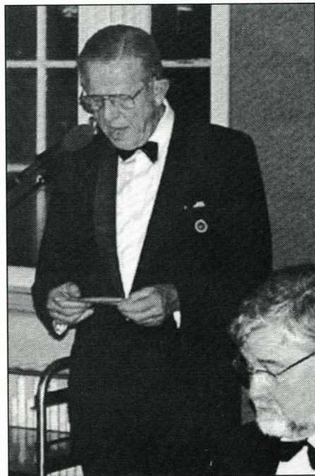
Formanden taler ved Kongeballet 2001.