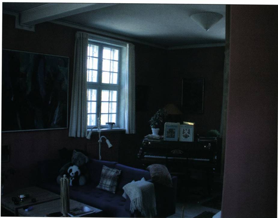
Stuen, hvorfra Holberg lød sin røst høre.

Jeg kan i øvrigt anbefale læsning af ovennævnte af Sorø lokalhistoriske Selskab udgivne bog om Tersløse Gård og Kirke – omtalt i Soranerbladet nr. 8, 2000.