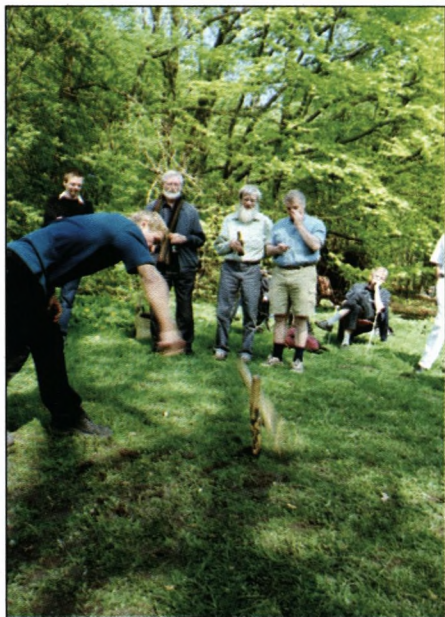
Sådan spilles batøk.