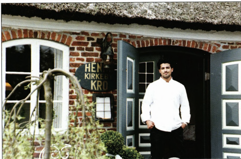
David foran hovedindgangn til Henne Kirkeby Kro. Det kan varmt anbefales at besøge kroen.