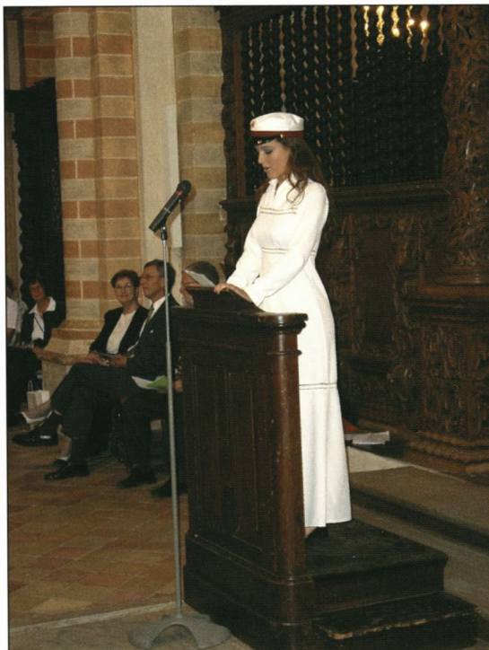
"Hvis denne hue har forandret os, så er det skolen, som har givet det hele mening."

I dag, for første gang som officielt modne voksne, vil vores forældre, vores venner og vores lærere, de mennesker, som har ledsaget os på vejen, og som har støttet os