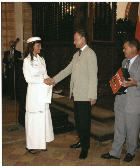
Formanden overrækker Samfundets gave til årets student.

Midlerne til dette formål har vi i vores Boligfond. De grundlæggende midler stammer fra soranere. Disse midler