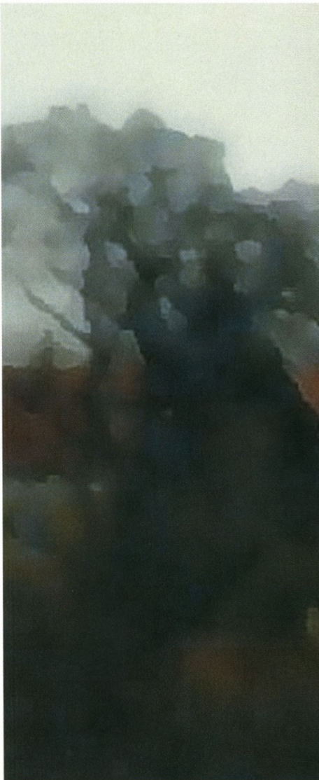
“Det svundne er en drøm”.

Trykkeriet tvivlede, men det var meningen: Et fotografi bearbejdet til et udtryk, der minder om akvarellens.