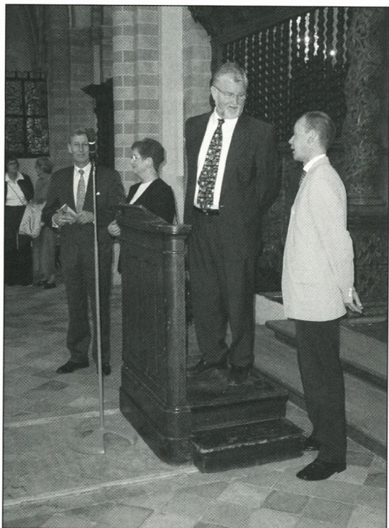
Den "unge" formands lidelser.

under uddannelsen eller i arbejdslivet har vi et samfundsmæssigt problem med vidtgående konsekvenser.