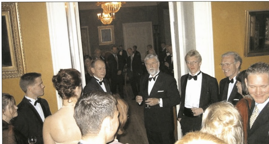
Rektor og Samfundets formand byder velkommen.

Udgangspunktet er en novelle af Hans Kirk, som min dansklærer her på Sorø Akademi præsenterede for os. "Støvlerne" hedder den, og den gjorde et stort indtryk på mig, da jeg første gang læste den.