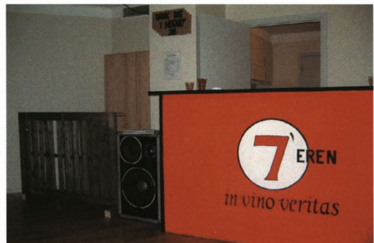
Hauerslevsalen som diskotek