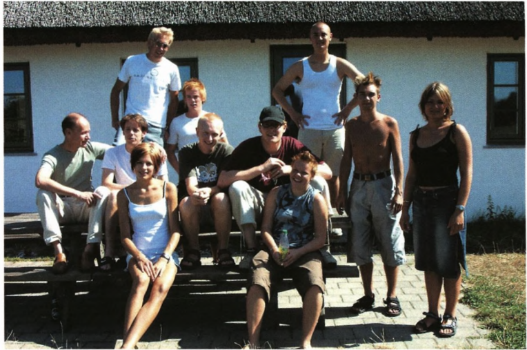
Yngre gammelsoranere på tur til Munkedamshuset i 2003

I beboerforeningen Sorani Securi samler vi trådene og forsøger at løse de knuder, der kommer, når der flytter 50 unge mennesker ind i nyt flot kollegium. Alle problemerne kan vi jo desværre ikke løse selv, så heldigvis har vi et tæt og godt samarbejde med husets bestyrelse og Soransk Samfund.