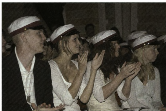
Glade studenter anno 2006

I har overværet og været aktive deltagere i en storslået forårskoncert, hvor både individuelle talenter har leveret flotte solopræstationer, og hvor samspilsgrupper har givet os oplevelser, hvis styrke og indtryk ligger i det, der præsteres sammen med andre. Hvert skoleår har sin flotte forårskoncert – det ved jeg godt – men hvor vil jeg savne at høre ”I kan ikke slå os ihjel”, selv om den i år gik over i ”De første kærester på månen”. Mon I har sikret jer arverækkefølgen til det indslag – eller skulle det være jeres årgang alene, der gav os voksne en vellydende rusketur med det nummer?