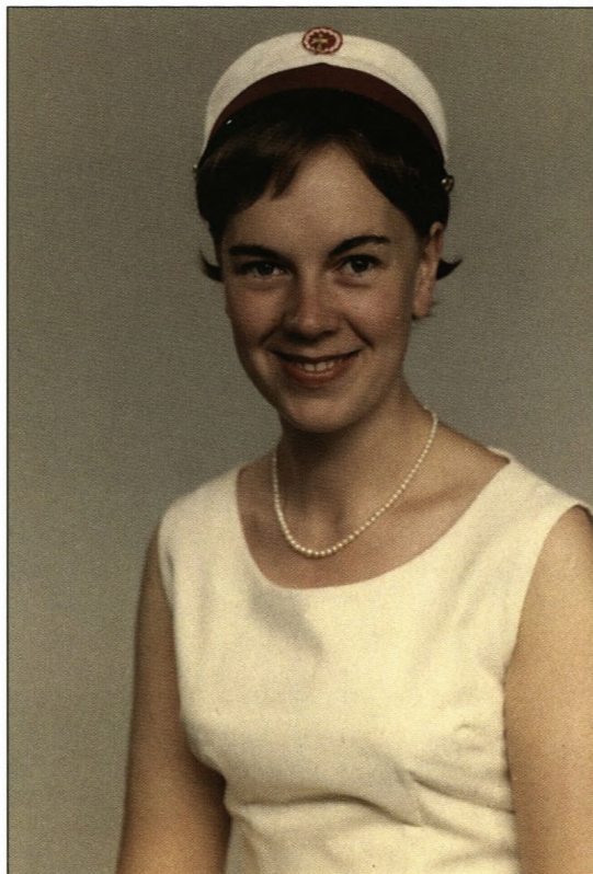
Nybagt student i 1966