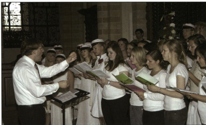
Skolens kor synger i Klosterkirken

Da Skjalm Hvide blev bygget, kom der et lokale i bygningens sydøstlige hjørne, hvor der på tegningerne stod "Café". Café var der de første år ikke blevet meget af, for man havde f.eks. ikke fået indlagt vand i lokalet, og det er jo en alvorlig forhindring for en café, hvis der ikke er vandhane og vask til rådighed. Indretningen i det hele taget ville være dyr: kopper, glas og tallerkener, en avanceret kaffemaskine, der kan brygge ordentlige caféers sortiment af varme drikke, en hurtigopvaskemaskine, skabe, borde, stole – ja, og så ikke mindst nogen, der ville tage sig af at drive caféen. Men I fik det til at ske. I dette skoleår er der åbnet en nydelig og hyggelig café i det dertil angivne lokale i Skjalm Hvide – en