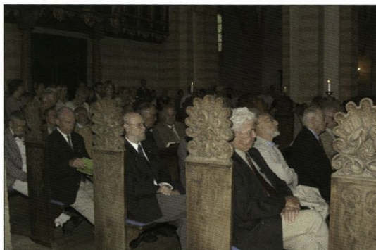
Årets studenterjubilarer i kirken

Særligt for de af jer, der har været alumner på kostskolen, er det en svær stund. Utallige er de tætte venskaber, der er blevet knyttet, mens I har boet her i tre eller for nogles vedkommende i fire år lige siden 10. klasse. I er kommet til at kende hinanden rigtig godt, for I har spist og sovet, moret jer og været kede af det sammen. I har været hinan-