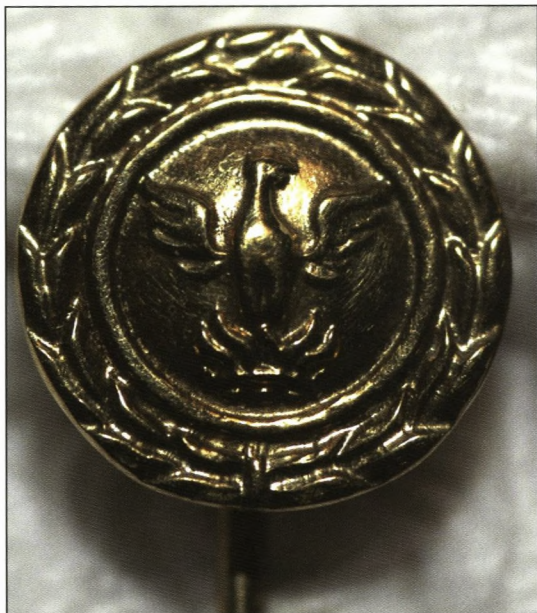
Soransk Samfunds soranernål i guld