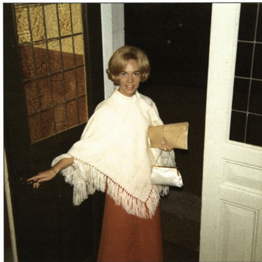
På vej til årsfesten 1971