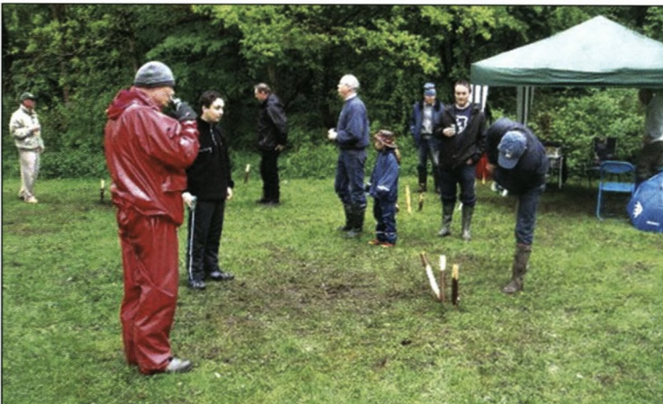
Energi og kræfter skal der til

PS: Et herloviansk ord dannes af den første konsonant + en del af sidste stavelse: FikfakkÆP=FÆP.