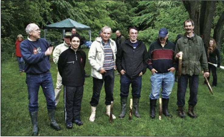
Gæve kæmper klar til dagens dyst