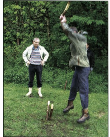
Ekstra kraft med et lille hop

Vinteren havde været kort og mild. Foråret var brudt tidligt igennem. Syrenerne havde allerede længe sendt tunge duftskyer ud fra haverne. Ligesom svalerne var kommet flere uger for tidligt, båret herop på milde forårsbølger, bagt af sydens sol, men ved mørkets frembud, dagen før kæmperne skulle mødes i Charlottenlund skov, begyndte en vedholdende regn. Ubønhørligt!