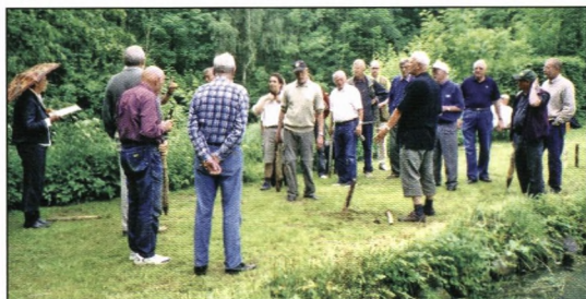
Så er slaget i fuld gang!