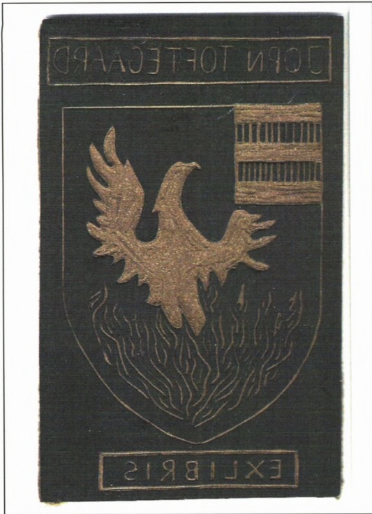
Dette exlibris er en linoleumblok udfærdiget af forfatteren i 2G under kyndig vejledning af formningslærer Jens Christian Ebbestad.

rer strækker sig, så langt øjet rækker kun afgrænset af San Francisco-bugten og de omgivende bjerge. Ideer og drømme blev engang født her og afprøvet i en garage eller omkring et spisebord. Det er senere blevet til globale selskaber som Hewlett Packard, Intel, Apple Computer, e-Bay og Google som eksempler på nogle af de mange hovedsæder her i dalen. Her er der penge, know-how, innovation, motivation og vilje. Præsidentkandidaterne står i kø for at besøge Silicon Valley med mulighed for at komme i mediernes og befolkningens søgelys og chancen for forbindelser til de pengestærke virksomheder.