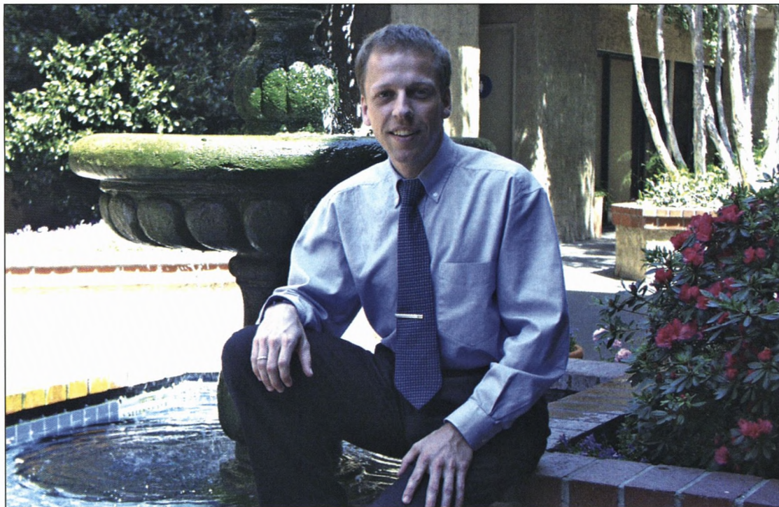
Forfatteren lynskudt foran sin klinik

Det er først i juni. Temperaturerne er stabile omkring 26-28 grader dagligt. Den første hedebølge har været på besøg, og den næste regn falder ikke før november. Der er et væld af frugt og grønt i butikkerne året rundt. Det meste er produceret lokalt. For en liter lavoktan benzin må bilisten med stor utilfredshed acceptere 5,18 kr. Den gennemsnitlige salgpris på enfamiliehuse var i april-maj 3,9 mio. kr.