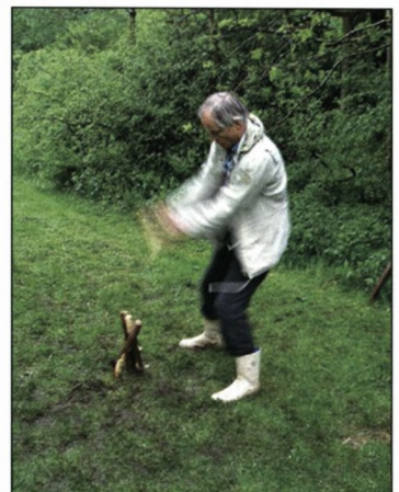
Se bare! – Hvad?