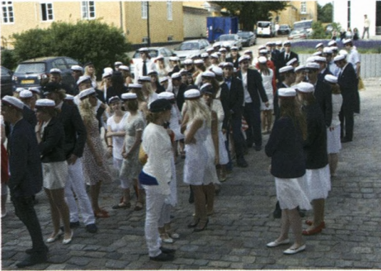
Årets studenter klar til indmarch i kirken