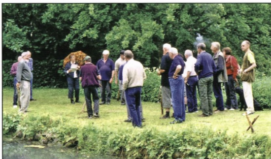
- og slaget fortsætter ....