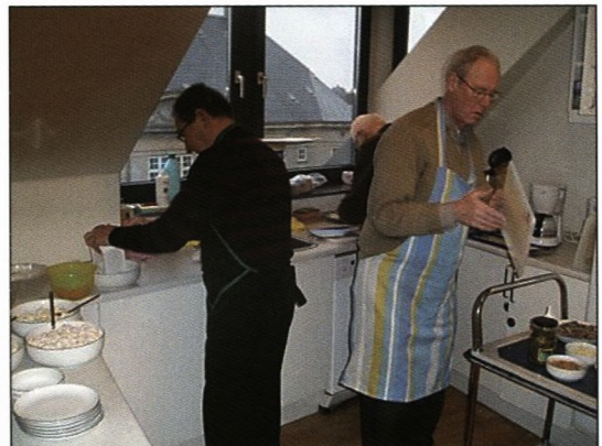
... og der arbejdes i køkkenet ...

"Hvor var det vi kom fra? Nåh jo. Vi havde spørgetime. Er der nogen der har spørgsmål?"