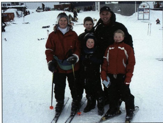
Søndag på alpinbakken.

lagte både, overnatter i biler, unge håndværkere i containere med minusgrader, hvis varmere overnatning ikke kan findes. Samtidig er Nuuk et sted med stor gang i byggeriet. Her bygges store, flotte lejligheder især i den nye bydel, Qinngorput, og mange lever i materiel velstand med store firehjuls-trækkere, jo større jo bedre, store motorbåde og ferierejser. Den sociale forskel er enorm, koncentreret på få kvadratkilometer. Det er som at lægge Rungsted Havn på Nørrebro og så hegne det hele ind med granit.