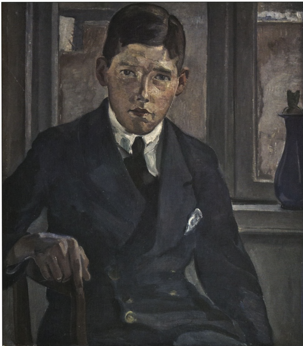
13-års dreng i soraneruniform Portræt udført af tegnelærer Siegfried Neuhaus i 1923

Medlemsblad for Soransk Samfund Årgang 93, nr. 2, april 2008