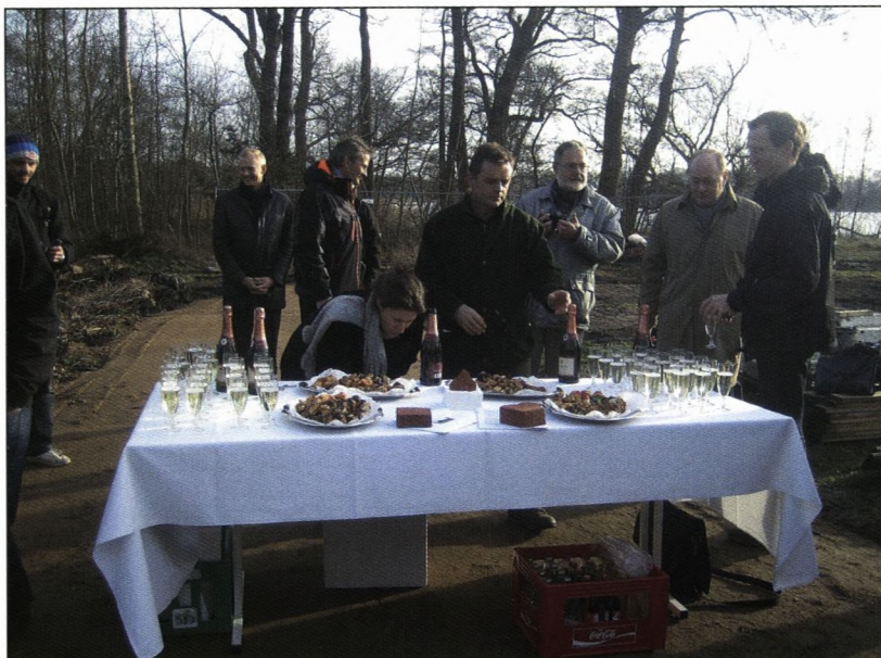
Til sidst var der vin og kransekage til alle