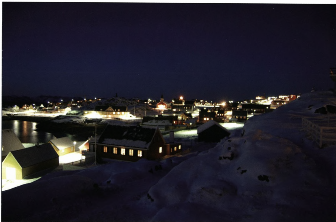
Kolonihavnen i decembermørke.

række, er flere mineralforekomster kommet i søgelyset, bl.a. den gamle bly/zink-mine "Den sorte engel" ved Ummannaq, diamantforekomster omkring Kangerlussuaq, guld på Storø, et fjeld-kast inde i Godthåbsfjorden (som den kaldes lokalt), tantal-niobium nær Narsaq i syd samt molybdæn i Malmbjerget nær Mestersvig, en 450 km syd for SORANERBRÆEN**.