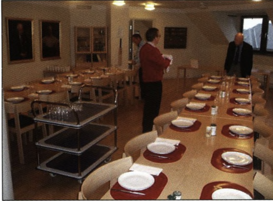
Der dækkes bord...

På en kold og meget blæsende vinterdag skulle der virkelig noget specielt til at overbevise mig om, at jeg skulle bevæge mig udendørs. Jeg lod mig overbevise (af min kone og mig selv) og kastede mig ud i vejret med kurs mod Solvej 1, Frederiksberg, hvor jeg mødte 32 ligesindede for indtagelse af årets første soranerfrokost.