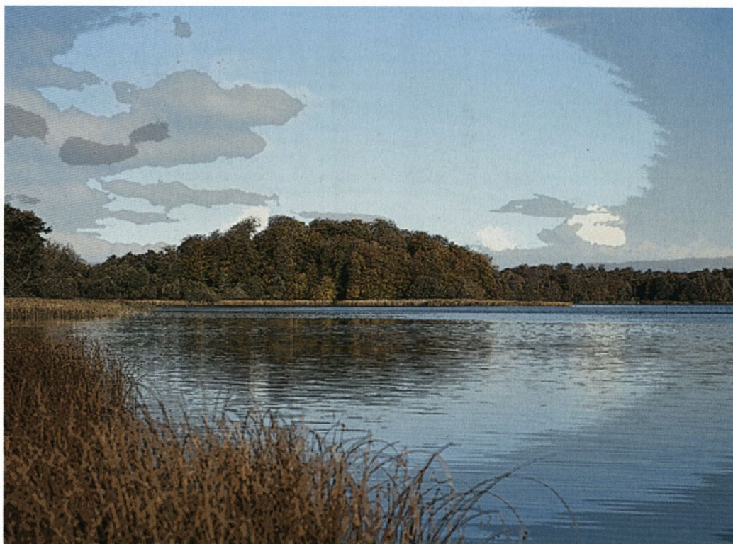
Høstbillede fra Sorø Sø