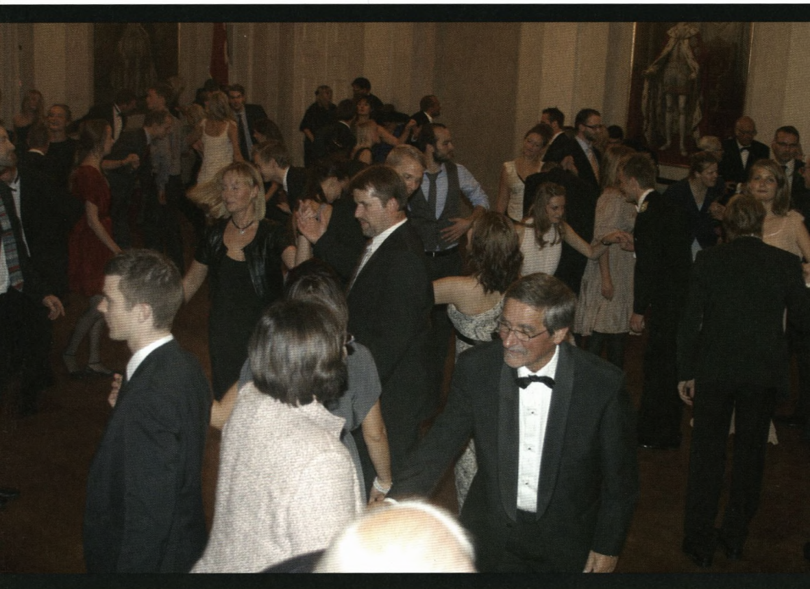
Lancier ved årsfesten 2010