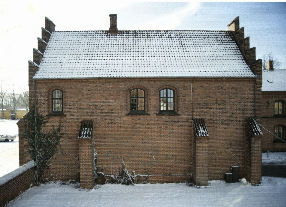
Klosterporten fra en sjældent set vinkel – og stadig vinterklædt.

Medlemsblad for Soransk Samfund Årgang 96, nr. 2, april 2011