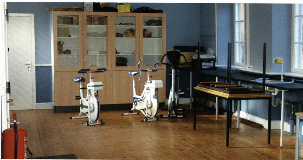
Nutidens motionscykler har afløst Akademiets heste i den gamle staldbygning