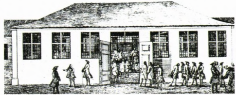
Frederik V beser Akademiets ridehus på sin rejse gennem Danmark og Norge 1749. Ridehuset blev ombygget til gymnastiksal i 1882