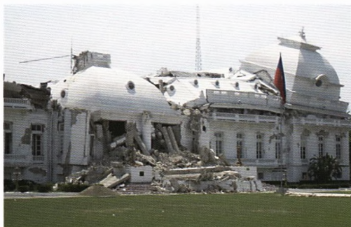
Det ødelagte præsidentplads i Port-au-Prince

Andre steder i byen var skaderne mindre påfaldende. De fleste bygninger var i forvejen dårligt vedligeholdt, og man var vant til, at skrald hobede sig op i gaderne.