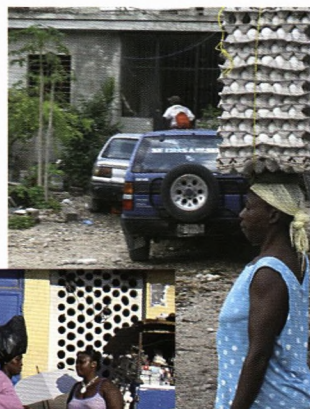
... og livet går videre på Haiti.

Efter valget i marts ser det ud til, at der er nye chancer for at komme videre med etablering af en nogenlunde funktionsdygtig regering, efterfulgt af stabilisering og genopbygning af landet.