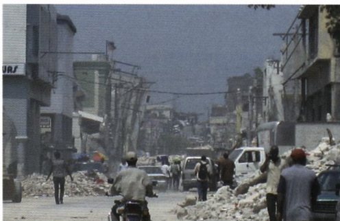
Ødelæggelserne i det centrale Port-au-Prince

I min korte periode på Haiti oplevede jeg det pulserende liv i Port-au-Prince. Skaderne fra jordskælvet var mest udtalte i byens centrum omkring regeringsbygningerne. Det gjorde stort indtryk at se præsidentpaladset, domkirken og flere flotte offentlige bygninger totalt ødelagte.