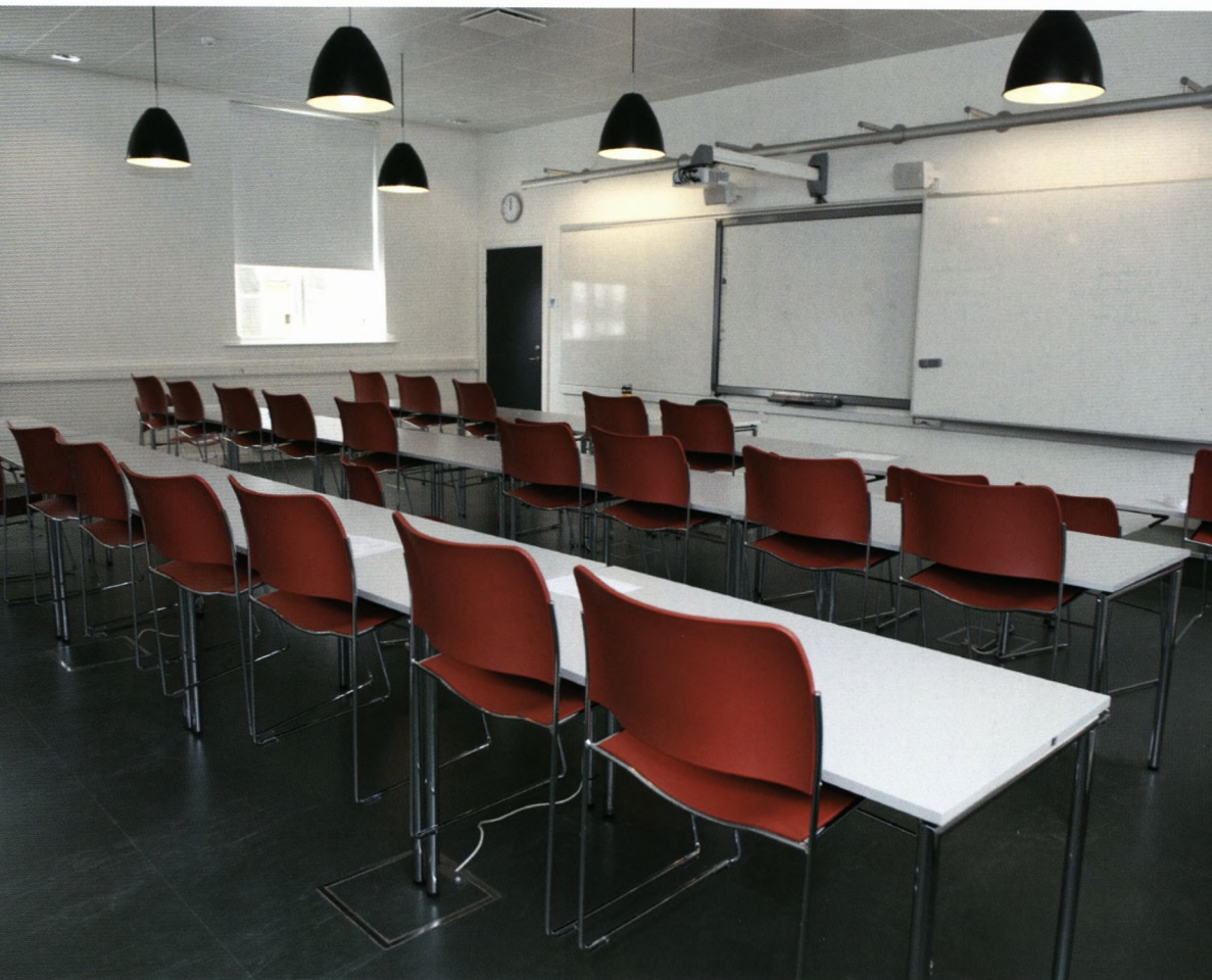
Undervisningslokale i stueetagen i den i 2010-11 istandsatte Naturfagsbygning