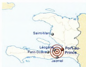
Skitse visende epicentret for jordskælv på Haiti 12. januar 2010, 7,0 på Richterskalaen.

Jordskælv ramte Haiti 25 km sydvest for hovedstaden Port-au-Prince d. 12. januar 2010 med en styrke på 7,0 efter Richterskalaen. Der er rapporteret 316.000 døde, 300.000 sårede og 1 million hjemløse. 250.000 boliger og 30.000 industribygninger blev totalskadede.