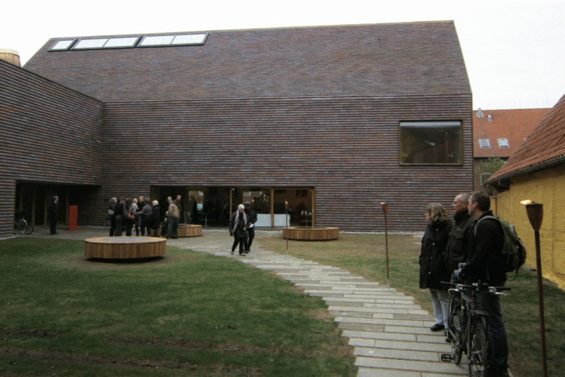
Den nye bygning set fra museumsgården

på, hvordan moderne arkitektur vil kunne føje sig til en eksisterende bygning med respekt for historien og de historiske omgivelser.