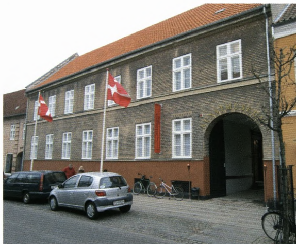
Den gamle bygning set fra Storgade

den langvarige debat den nuværende, højst tiltrængte udvidelse af museet, placeret lige midt inde i byen.