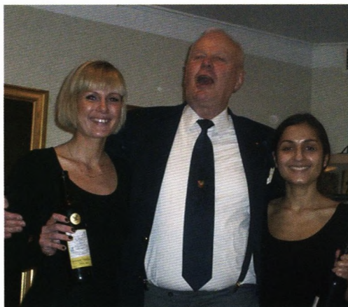
Formanden i godt selskab