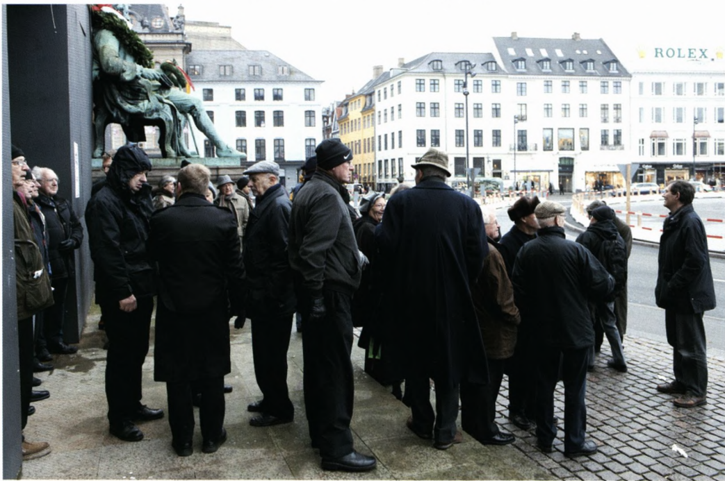
Samling foran Det Kongelige Teater.

Traditionen tro mødte en trofast skare op på Kongens Nytorv i København lørdag den 3. december 2011 for at hyldes Sorø Akademis store mæcen, Ludvig Holberg, på hans fødselsdag ved at placere en krans på hans statue foran Det Kongelige Teaters Gamle Scene.