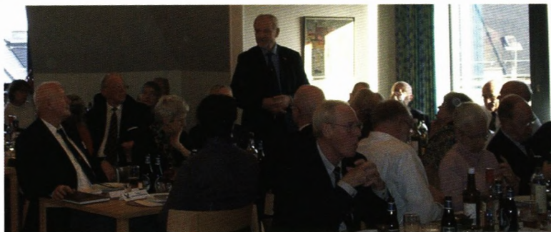
Redaktøren orienterer om Soranerbladets jubilæumsnummer,