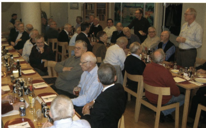
Hovmester fortæller om dagens kulinariske herligheder