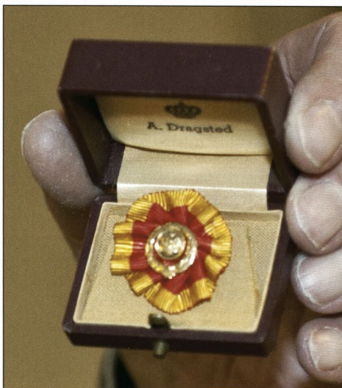
Flere billeder på www.soranerarkivet.dk