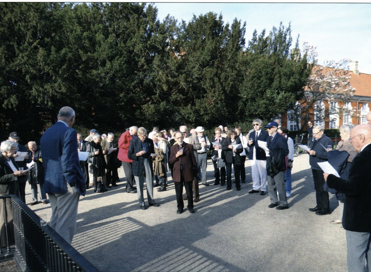
Valborg aften i Frederiksberg Have

Medlemsblad for Soransk Samfund Årgang 97, nr. 4, august 2012