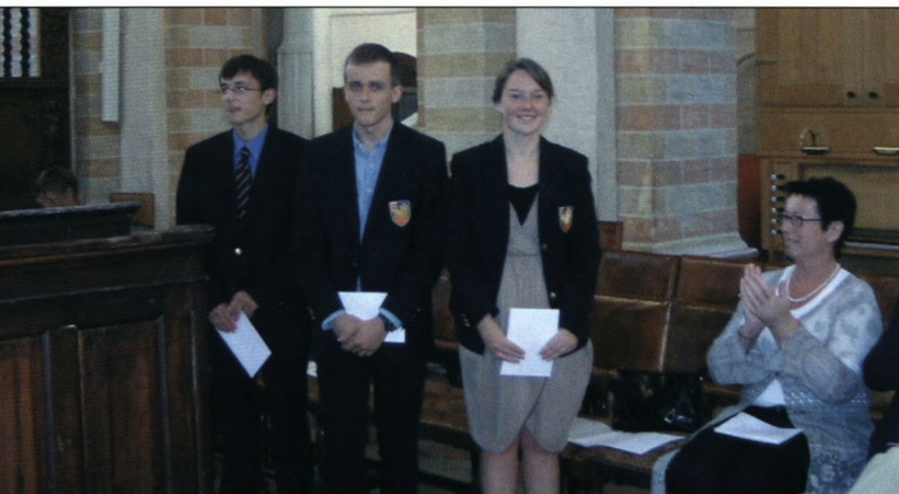
Flidspræmiemodtagerne og rektor.

Lørdag den 23. juni havde Sorø Akademis Skole for fjerde år i træk inviteret de gammelsoranere, som kunne fejre enten deres 25-års, 40, 50, 55, 60 eller 65 års skolejubilæum til en festlig markering af dagen og året.