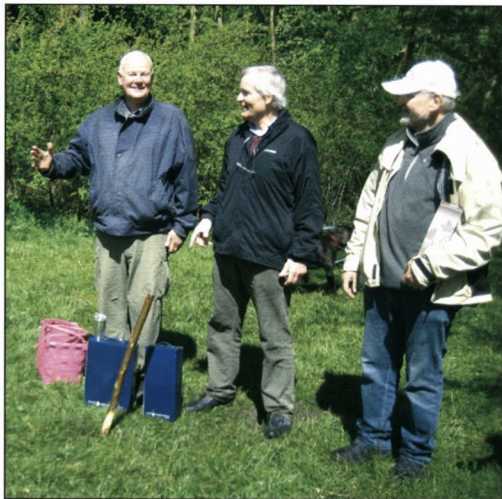
De tre vindere.

Det var en ny Kr Himmelfarts morgen, skyet og regnfuld. Men intet kan hindre forårets fortsatte fremdrift. Forårsbølger af blomstring og grøn udfoldelse havde, trods kulden, rullet hen over landet. Slåen og hægen struttede i de levende hegn, der omkranser plænen i Charlottenlund Skov. Og så naturligvis Batøkken, og kæppene, der skulle sættes i den fugtmættede jord. 9 fra Sorø og 9 fra Herlufsholm var trods vejret mødt op til venskabsdysten. Det blev et sønderknusende nederlag, som i slaget ved Lund og Dybbøl. Kun "unge Siemssen" overlevede af Herlovianerne i de indledende slag og kunne fortsætte i finalen, det