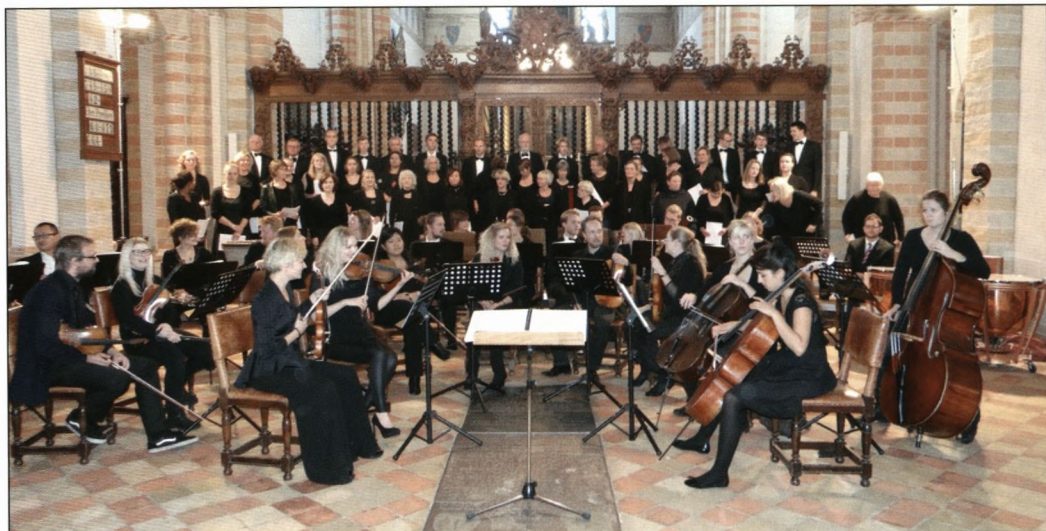
Kor og orkester i kirken