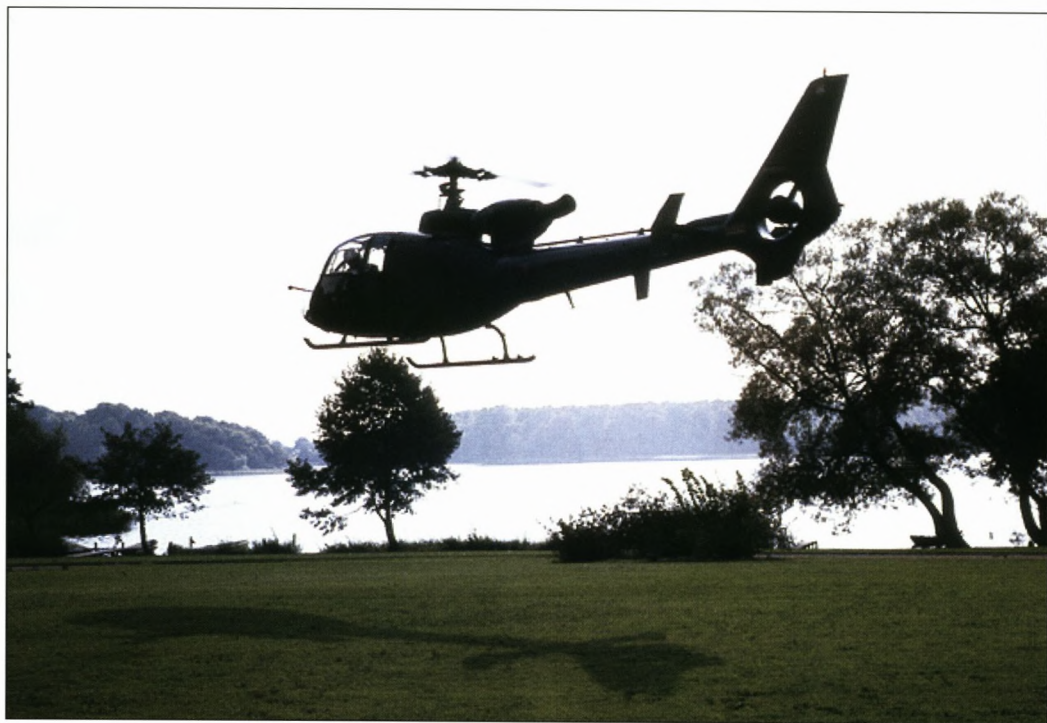
Helikopter med den amerikanske ambassadør om bord lægger an til landing på plænen mod søen.