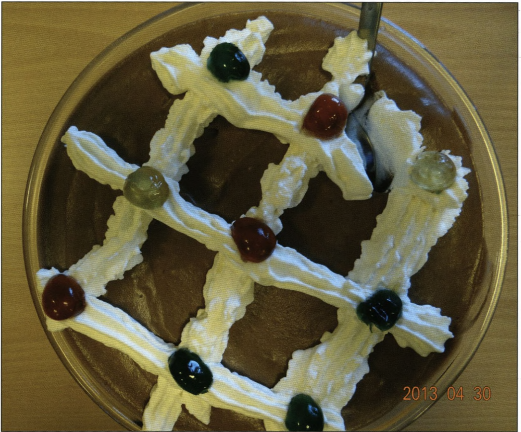
Den verdensberømte chokolademousse fra Valborg aften, foto Ivan Jørgensen (S73)

Medlemsblad for Soransk Samfund Årgang 98, nr. 5, oktober 2013