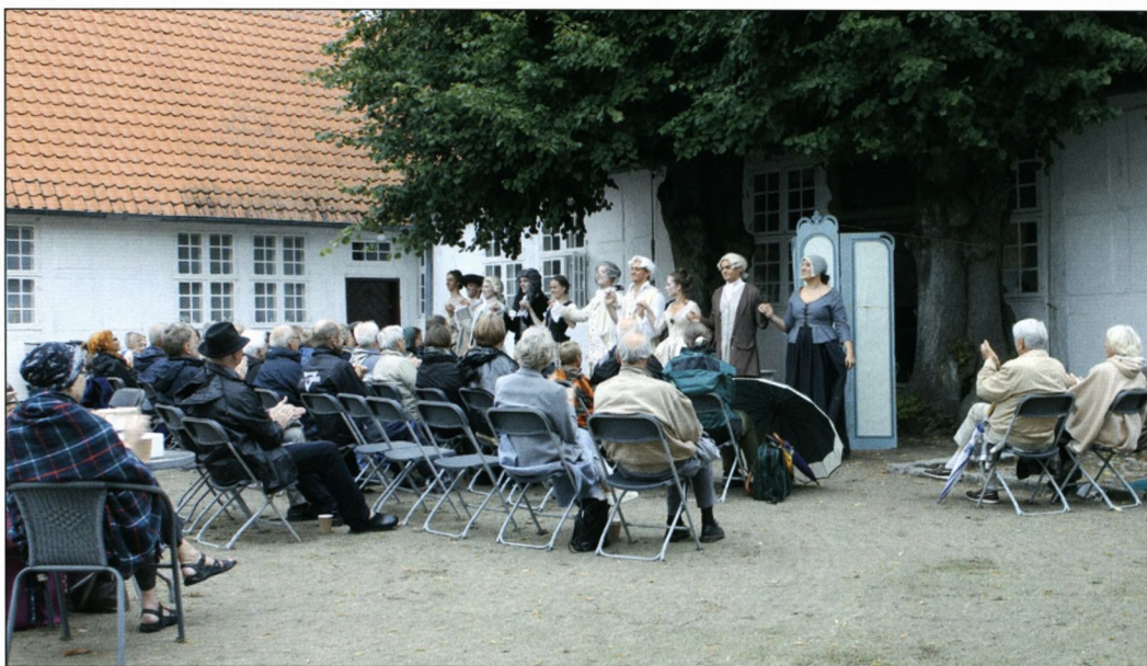
Teaterselskabet PSV fra Århus.

Igennem en årrække har vi hver sæson valgt et nyt tema for på den måde at gøre op-