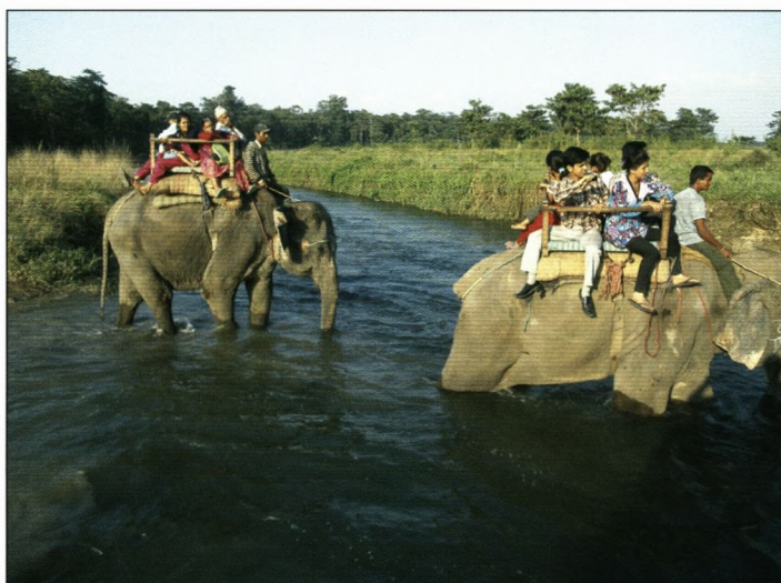
Safari i Chitwan