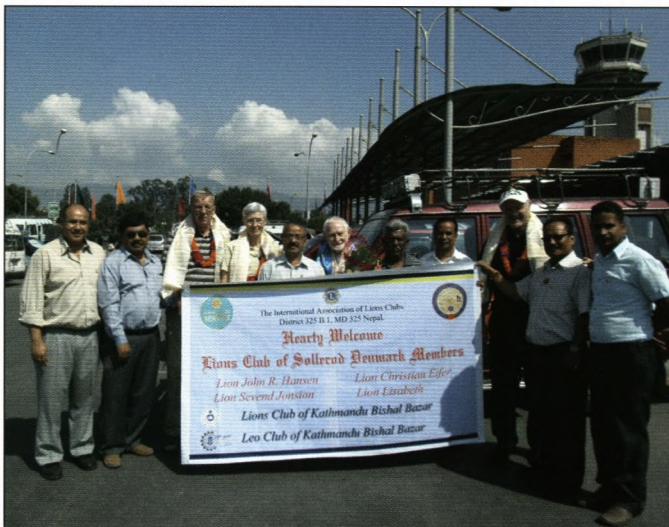
Velkomst i Kathmandu lufthavn

Vi blev mødt med en venlig og overdådig gæstfrihed og bestrøet med blomster og hinduistiske tørklæder og hatte af smilende hjælpsomme mennesker, der alle bidrog til den positive oplevelse.