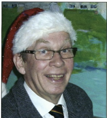
Kassereren som julemand

ikke det fulde overblik over navnene, så "Ingen nævnt – ingen glemt" – for nu at udtrykke det på kortest mulig måde, men samtidig skal jeg udtrykke min glæde over at så mange deltog. Det er en god ting for os at præsentere vore sammenkomster for de bedre halvdele, såvel julefrokosten som Valborg Aften.