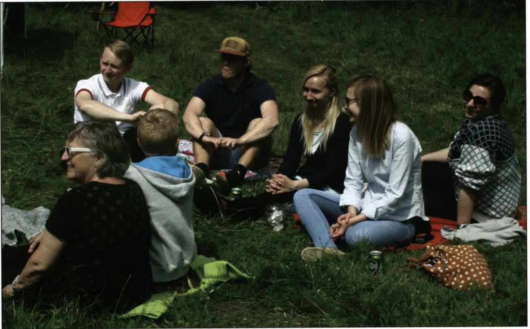
Stemmingsbillede batøk Charlottenlund.