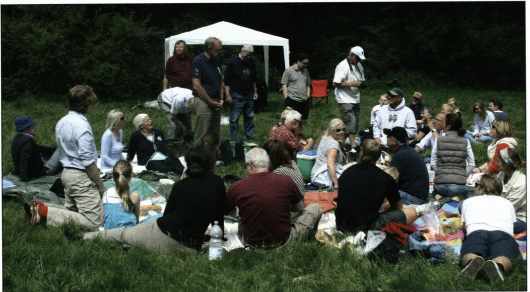
Så er der frokost i det grønne.