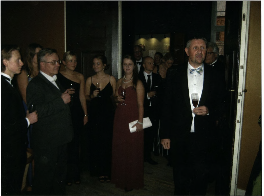
Rektor overdrager skolen til årsfesten