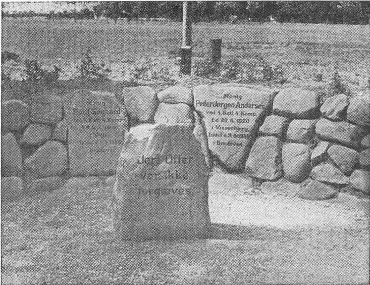
Mindestenene ved Bredevad.