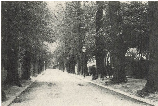
Jægersborg Allé i Begyndelsen af Aarhundredet.