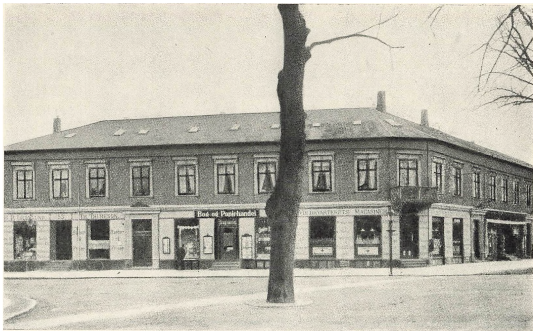
Lindegårdsvej ved Jægersborg Allé – 1910.