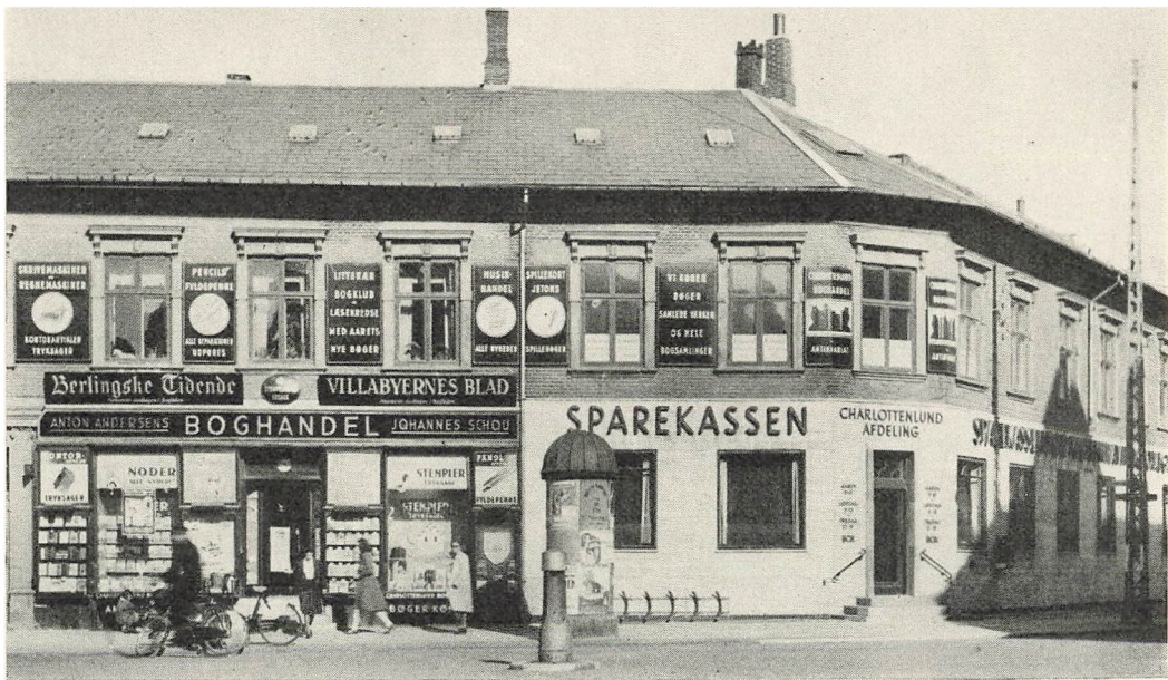
Hjørnet af Jægersborg Allé og Lindegaardsvej – 1942.