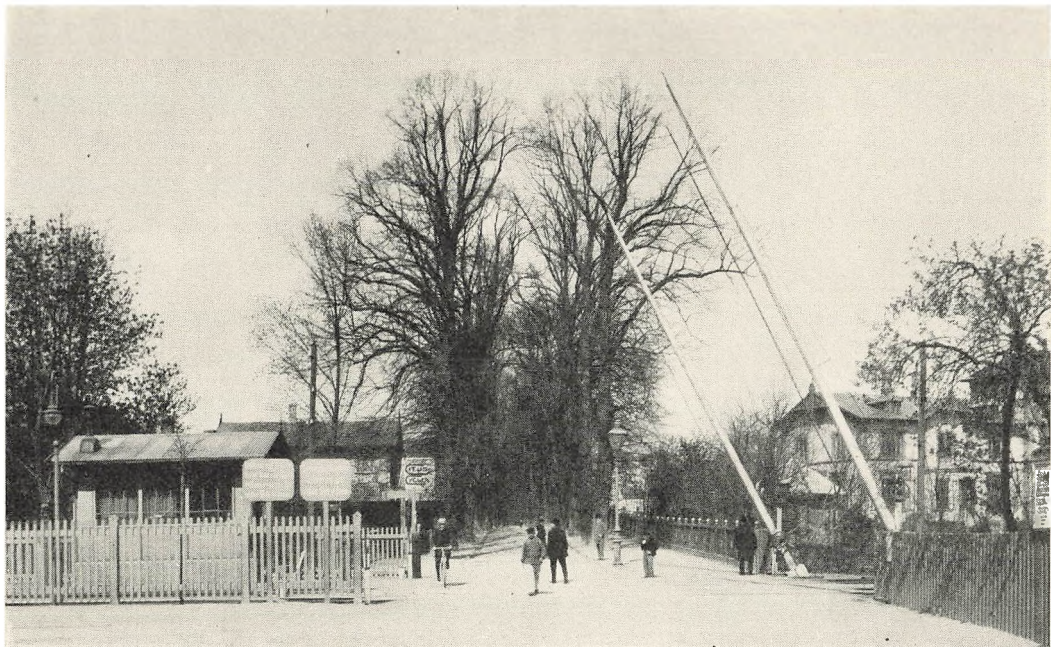
Bommen ved Charlottenlund omkring Aarhundredskiftet.