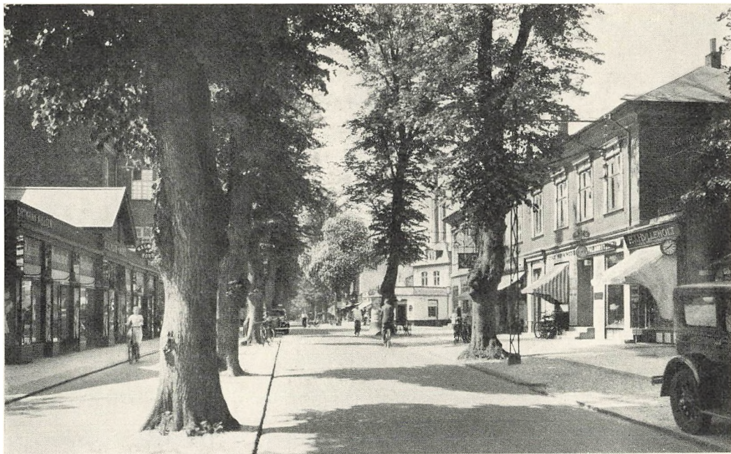
Jægersborg Allé ved Lindegaardsvej – 1937.