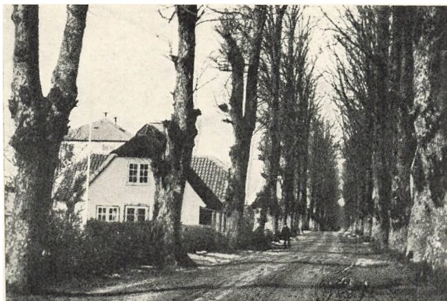
Jægersborg Allé's Udseende i 90'erne.