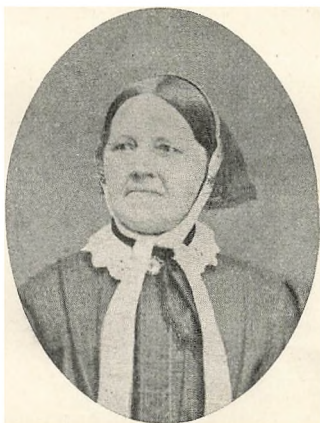
MIN MOR 1870. 61 AAR.