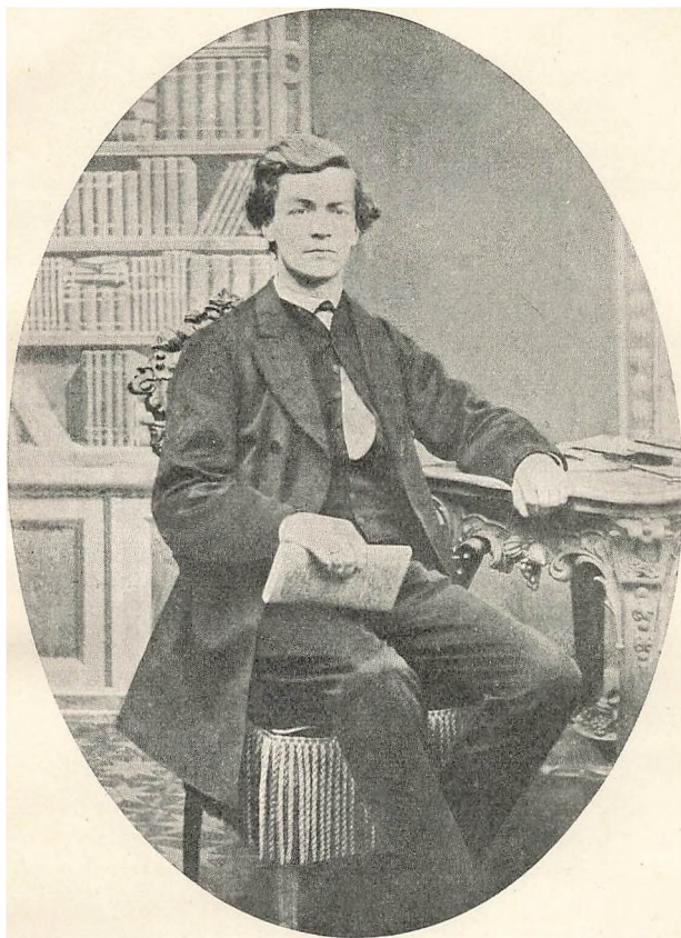
KLAUS BERNTSEN 1869. 25 AAR.