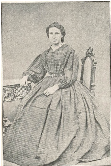
MIN HUSTRU 1869. 22 AAR.