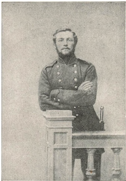
MENIG Nr. 1 VED 5. BATAILLON. 1866.