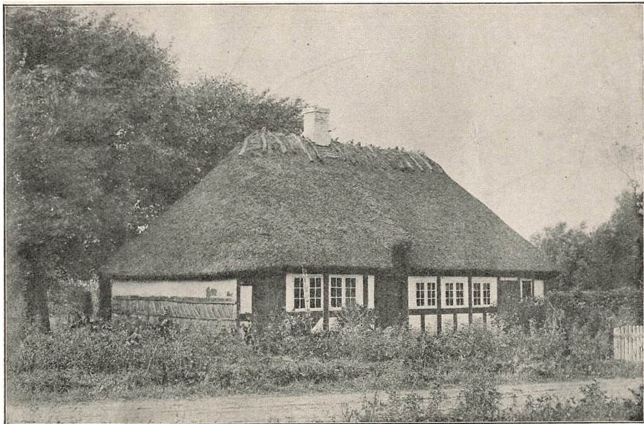
HØJBY FØRSTE FRISKOLE 1862—69.