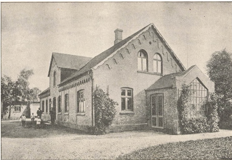
SÆRSLEV HØJSKOLE (1882).