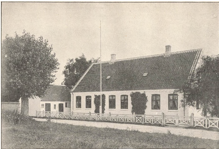
HØJBY FRISKOLE (1881).