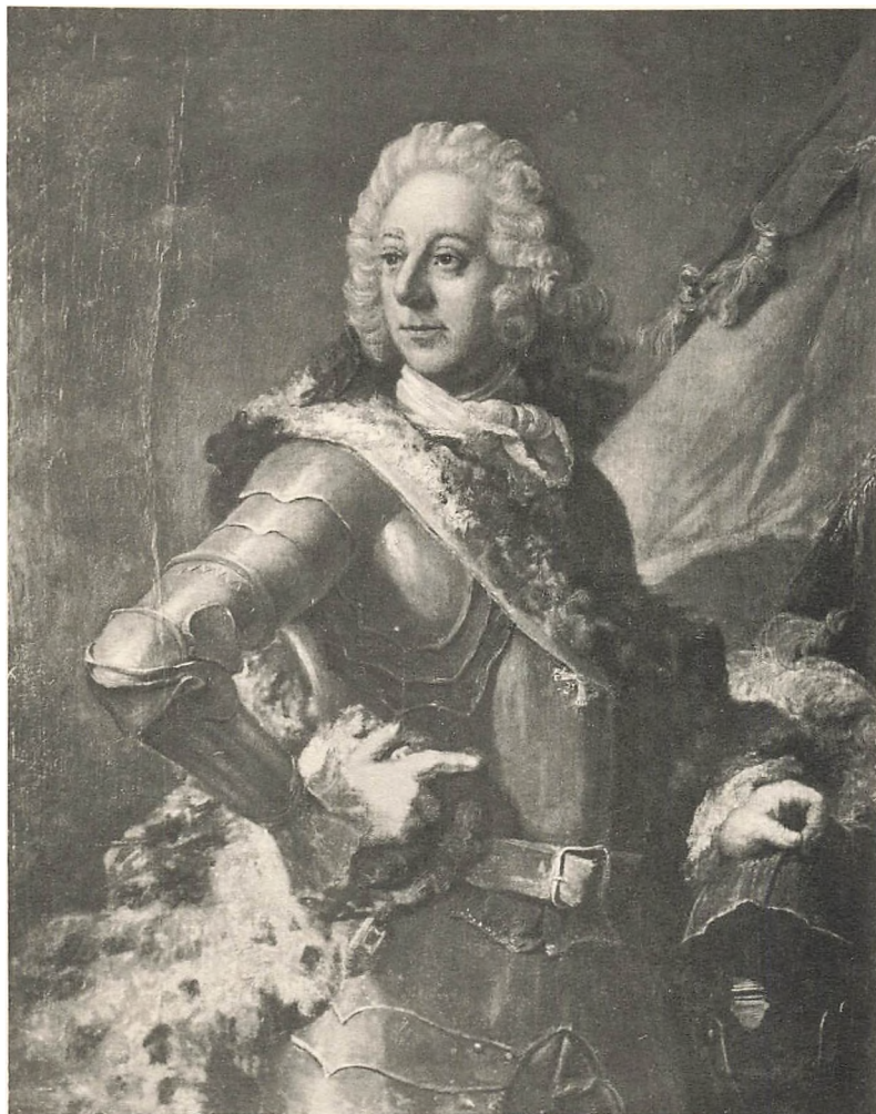
General Gustav Grüner

(efter Maleri paa Frederiksborg Museet).