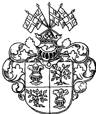
Det Slægten Numsen i 1688 tildelte Vaaben.

Generalen havde tilbragt sit Liv i Arbejde for Konge og Land, men baade Christian V og Frederik IV havde ogsaa paaskønnet hans Dygtighed og Pligtopfyldenhed. Han var avanceret til meget høje Stillinger indenfor Hæren, og allerede i 1688 var han blevet optaget i Adelmanstanden ved et ham under 24' Mai tildelt Vaabenbrev. Det har været Tvivl underkastet, om et saadant Vaaben-