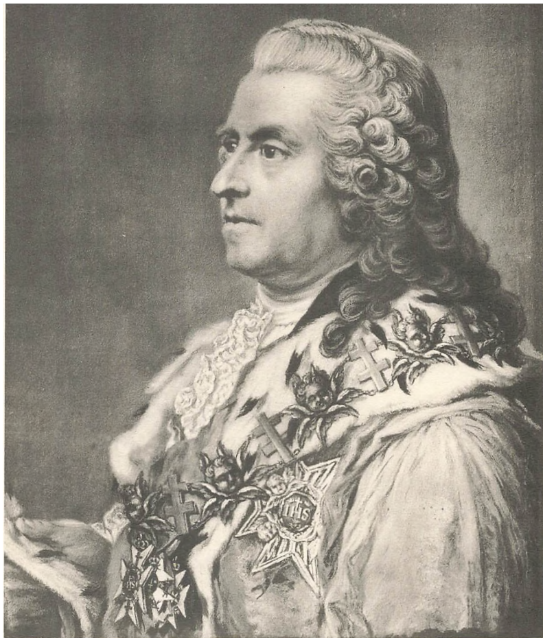
Kancellipræsident, Greve Carl Gustav Tessin

(efter Maleri af Gustaf Lundberg paa Nationalmuseum i Stockholm).