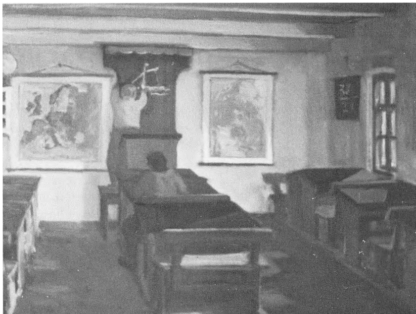
Vestjysk skolestue malet af Eiler Løndal (f. 1887). Privateje.