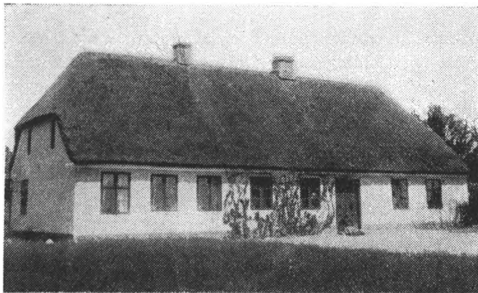
Højrup Skole omkring 1880.

i mit Liv, endda i en saadan Grad, at jeg egentlig kun er bleven det, som der allerede i min Barndomstid blev lagt Grund til. Naar jeg tænker tilbage paa denne Tid, synes jeg, at den i alt væsentligt har været en lykkelig og god Tid. Og jeg tror ikke, at det er Afstanden i Tid, der nu kaster sit gyldne Skær over Barneminderne, men saaledes har det altid været for mig saavel som for mine Sødskende. Vi har altid følt os meget stærkt knyttet til vort Barndomshjem og ofte takket Gud for, hvad han der gav os.