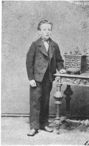
I 12 Aars Alderen.