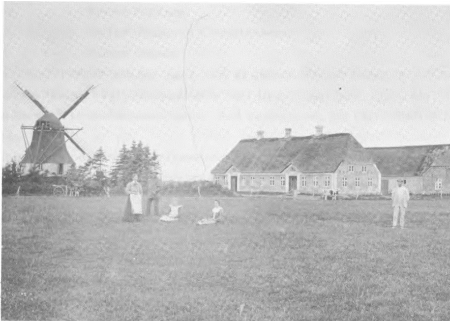
Billum mølle og møllegaard