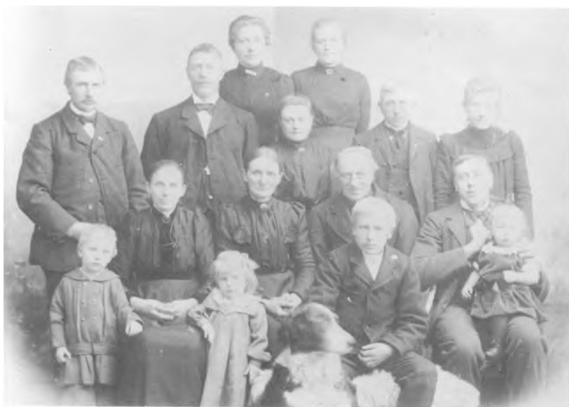
III. Ægteparret med børn, svigerbørn og børnebørn