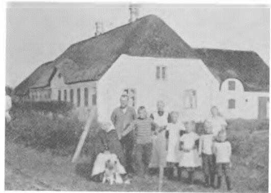
XI. Familien foran gaarden Knudsminde i 1911