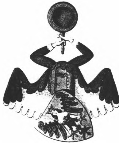
Slægten Kalfs moderniserede Vaaben (Gengivet efter Danmarks Adelsaarbog)