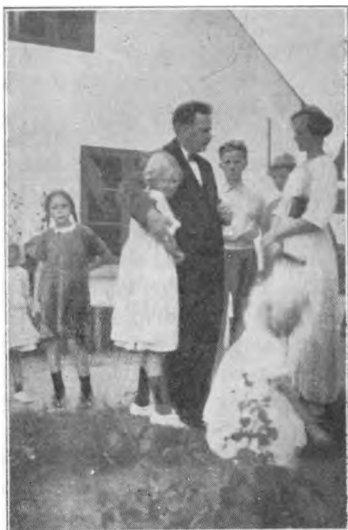
Fra mødet 1.—8. august.

efter denne tid. Nu fik vi imidlertid i aar meget tidlig høst, og det kneb derfor ikke saa lidt for flere af deltagerne at være hjemme fra i disse 8 dage. De blev her alligevel, og det var godt gjort, men vel ogsaa et vidnesbyrd om, at vi her paa skolen ikke var de eneste, som var glade for dette samvær. Jeg tror derfor nok, jeg tør sige, at det var en god oplevelse for os alle. Vi glemmer i hvert fald ikke let disse dage med deres rige indhold.