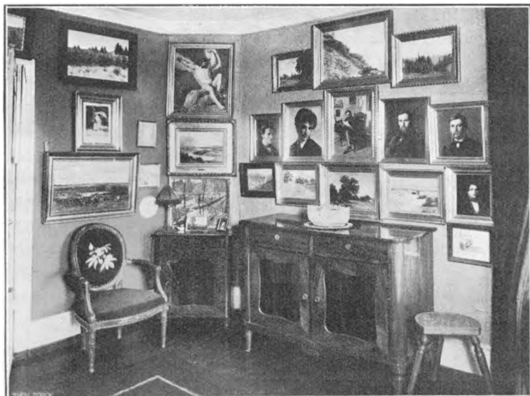
Interiør fra Skjold la Cours Stue.

Og som hans Hjem var, saadan var han selv: beskeden og fin. Han var stiltfærdig i Færd og hurtig i Tanke. Han talte aldrig om sine egne Fortjenester, og vilde vi andre, som stod ham nær, tale om dem, saa slog han det hen.