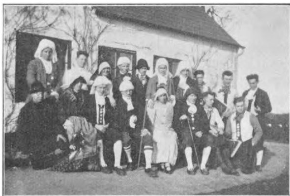
„Skriver, I Karle!“