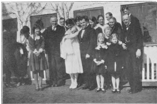
Fra Dan's Daabsdag.

Min svoger var medlem af Askov valgmenighed. Det havde han været siden sin mors død. Han gik altid i kirke i