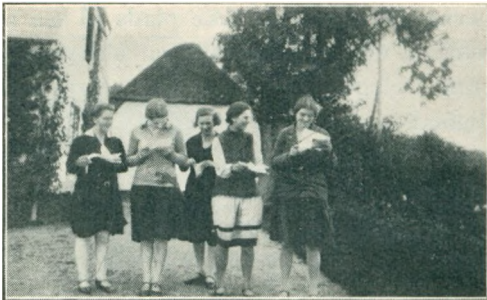
Endelig kom Posten! (Fra Efteraarsskolen 1930.)

Om den ny skoles begyndelse den 1. september har jeg fortalt andet steds i aarsskriftet, og jeg kan derfor slutte denne oversigt over aarets smaa og store begivenheder med tak til jer, som hjalp til med at give dette aar indhold og vækst for os.