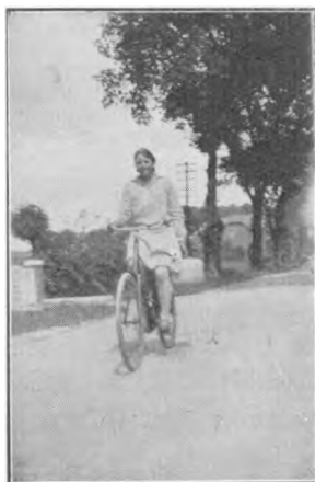
Hjem — med Pakke fra Mor. En 5-Punds Lagkage!