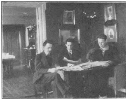
Tre Lærere studerer sidste Nyt.