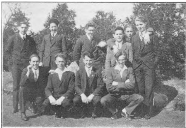
Vaaren er i Luften.