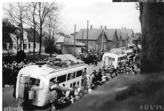
Billede: De hvide busser standser ved Røde Kors teltet på hjørnet af Haderslevvej og Piledamsvej.