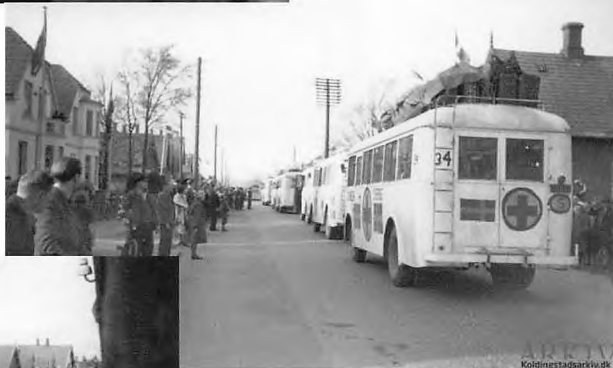
Billede: En stribe hvide busser på vej ned ad Haderslevvej.