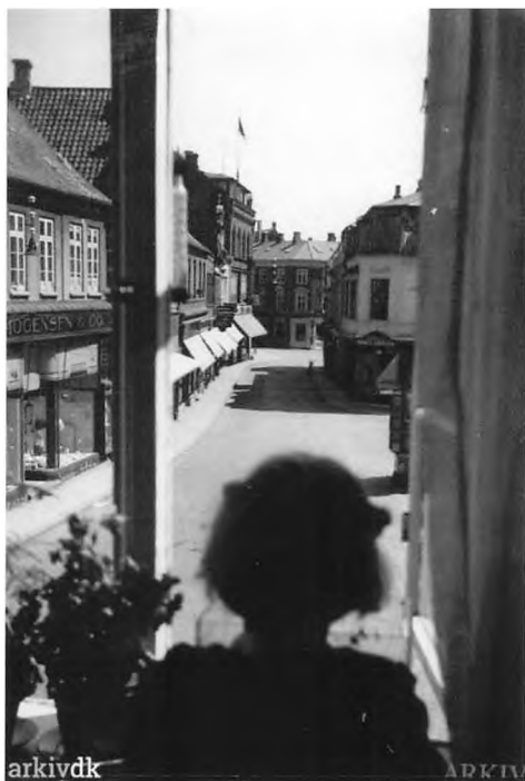
Billede: Udsigt fra Adelgade 11 under luftalarm. Gaderne er mennesketomme. Dateret: 19. juni 1943, kl. 13.00.