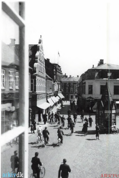
Billede: Efter afblæsningen af luftalarm myldrer gaderne atter med cyklister og gående. Udsigt fra Adelgade 11. Dateret: 12. juli 1943, kl. 14.00.