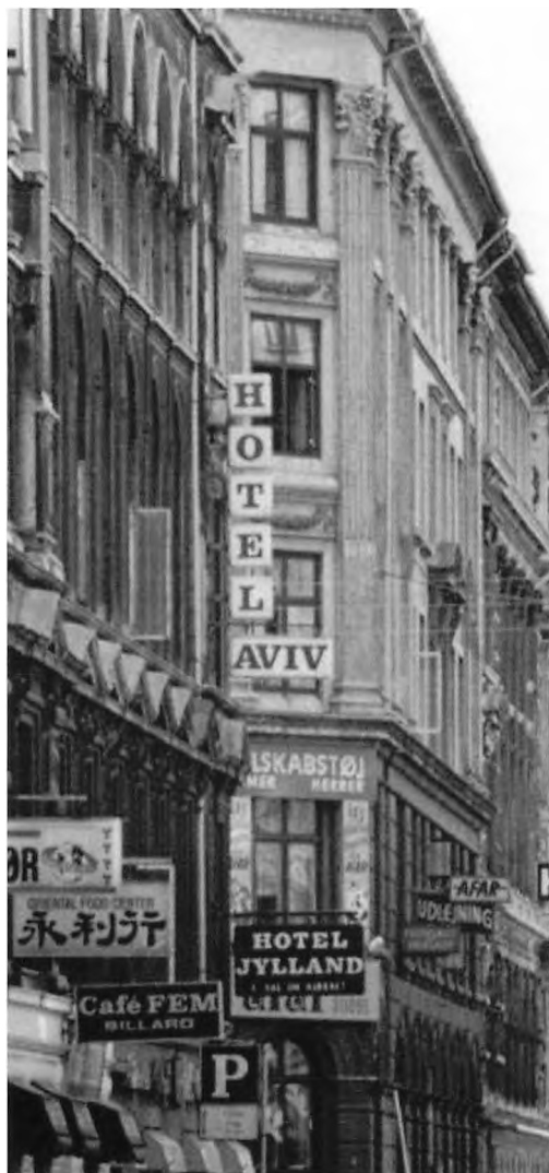
Billede: Hotel Aviv i Colbjørnsensgade i København.