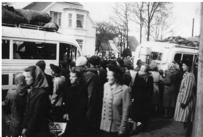
Billede: De hvide busser gør holdt på Haderslevvej i Kolding, 22. april 1945.

De hvide busser hentede fangerne i Theresienstadt den 21. april og allerede den 23. april var de udlånte rutebiler tilbage i almindelig drift igen. De fleste danske fanger blev befriet på den måde. Dog blev en eller to tilbage i Theresienstadt, da de ikke var til stede, da busserne kørte, og så var der 150 danske kommunister, der var fanget i koncentrationslejren Stutthof.