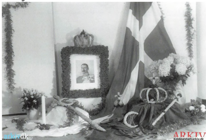
Billede: Blomsterhandler Levisons vinduesudstilling i anledning af Kong Christian X's 70års fødselsdag, den 26. september 1940. Arkiv: Kolding Stadsarkiv.