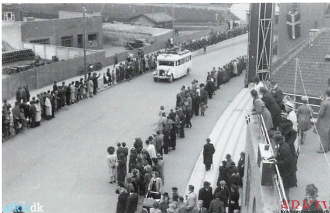
Billede Folkemængde samlet for at tage imod De hvide busser i Bredgade, Kolding, 22. april 1945.