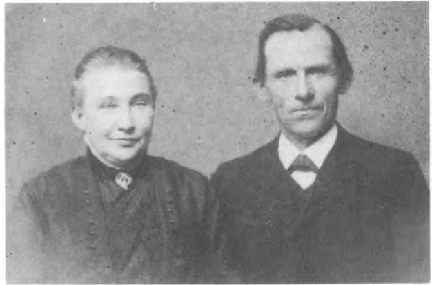
Toustrup, Durup sogn