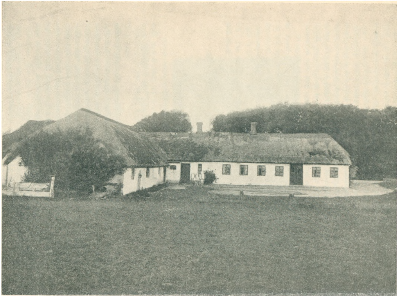
Hjemmet i Erslev, der efter Ombygningen fik Navnet »Bjerregaard«.