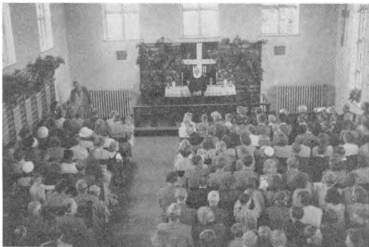
Fra Gudstjenesten ved Elevmødet.