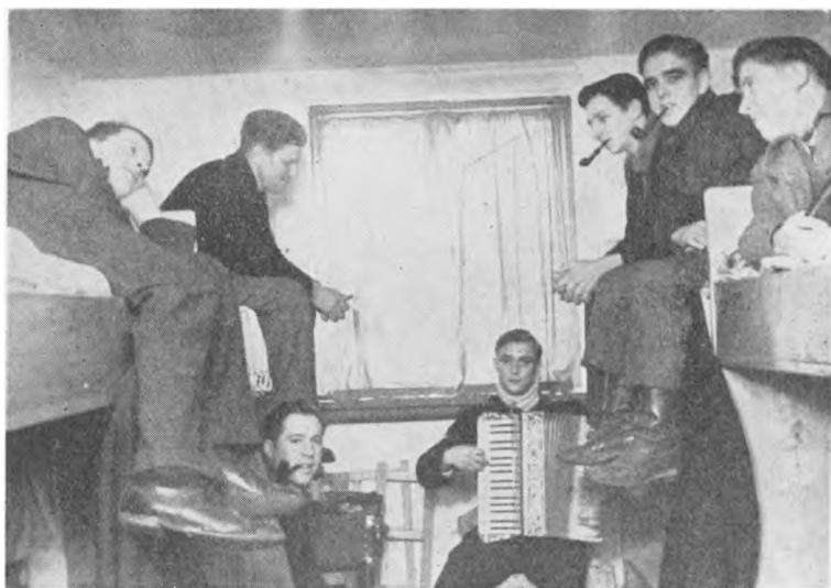
Otte paa eet Værelse kræver godt Kammeratskab (Grænseshjemmet).

Skolen i Besiddelse. Paa det Tidspunkt var det omsider lykkedes at komme af med vore paatvungne Gæster.