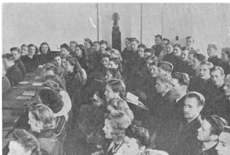
Frå »Rundesalen« paa »Grønselhjemmet«.

Mennesker. Men alle tog det med godt Humør, og bagefter har jeg hørt mange af Eleverne sige, at de nødigt vilde have undværet denne Begyndelse. Vi lærte omgaaende hinanden at kende, og det var en i sjælden Grad sammenrystet Flok, der i December tog