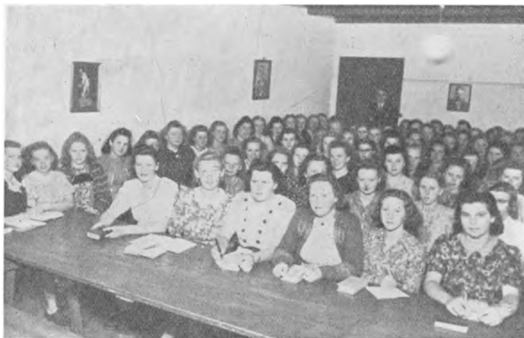
Foredragssalen var fyldt.

I April var jeg som sædvanlig ude paa Foredragsrejser. Herhjemme var der Travlhed med at faa det hele mest muligt i Orden, inden det store Sommerhold skulde ankomme. Her blev malet, slebet Gulve, fornyet og repareret over det hele. Navnlig Gulvene hjalp det paa.