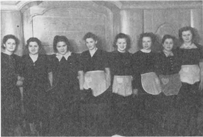
Otte raske Piger.

Vi gennemførte planmæssigt vore Ture til Dybbøl og Vester-egnen. Det er dejligt igen at kunne leje Rutebiler.