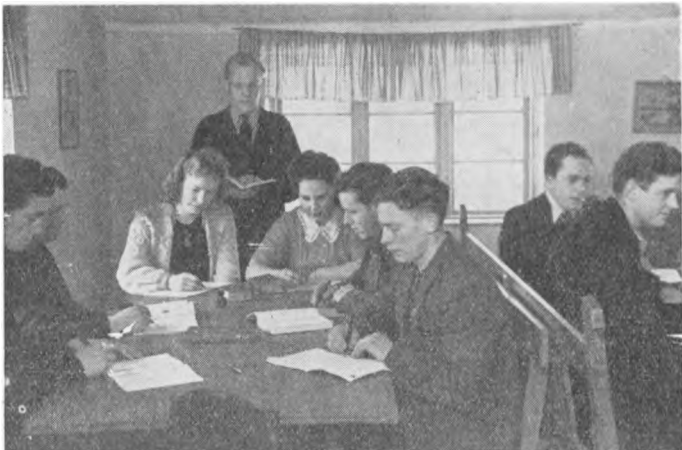
Bülow har Time.

havde vore dygtige Piger gjort rent til Bunds; men udenfor flød det stadig med Efterladenskaber, og det gjorde det ikke bedre, at Grøfterne til vort nye Vandværk ikke var tildækkede. Til Gengæld havde vi da faaet rigeligt og filtreret Vand, og dermed er een af de ydre Skavanker, som Skolen vist i hele sin Tid har haft at slaas med, forhaabentlig for bestandigt afhjulpet. Krog har været meget ivrig efter at faa dette gennemført, og det skal han have Tak for — selv om det blev dyrt, uhyggelig dyrt.