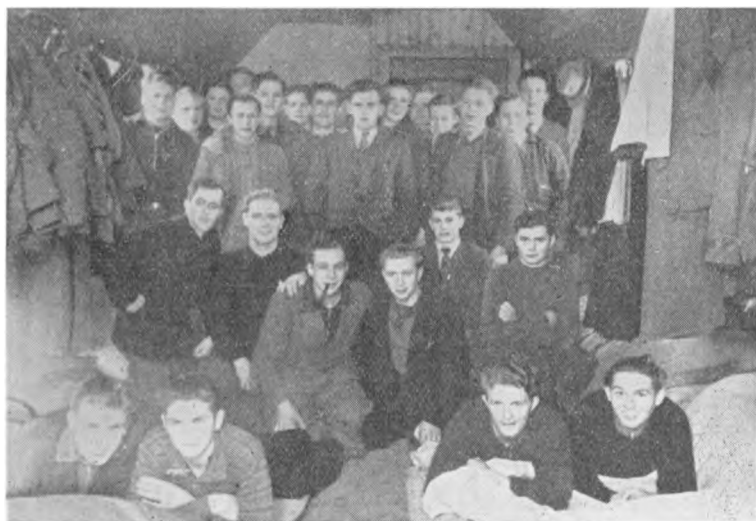
Sovesalen var tæt belagt.

Mennesker. Men alle tog det med godt Humør, og bagefter har jeg hørt mange af Eleverne sige, at de nødigt vilde have undværet denne Begyndelse. Vi lærte omgaaende hinanden at kende, og det var en i sjælden Grad sammenrystet Flok, der i December tog