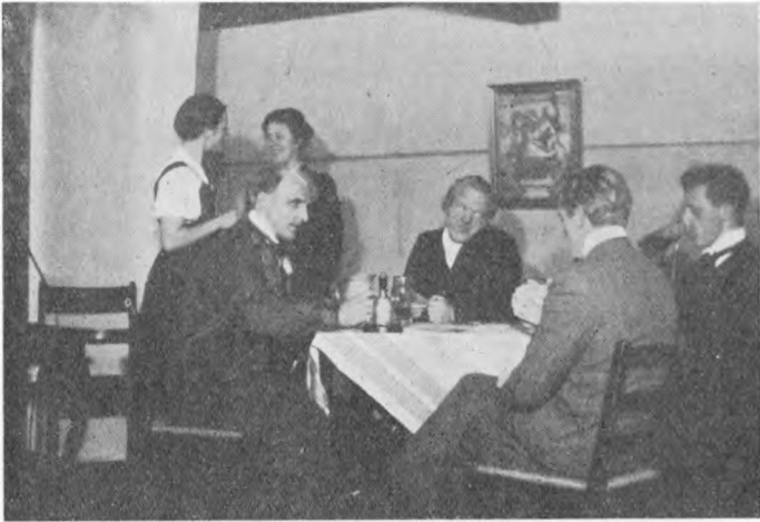
Scene fra Fæstelvnskomedien.

havde vore dygtige Piger gjort rent til Bunds; men udenfor flød det stadig med Efterladenskaber, og det gjorde det ikke bedre, at Grøfterne til vort nye Vandværk ikke var tildækkede. Til Gengæld havde vi da faaet rigeligt og filtreret Vand, og dermed er een af de ydre Skavanker, som Skolen vist i hele sin Tid har haft at slaas med, forhaabentlig for bestandigt afhjulpet. Krog har været meget ivrig efter at faa dette gennemført, og det skal han have Tak for — selv om det blev dyrt, uhyggelig dyrt.