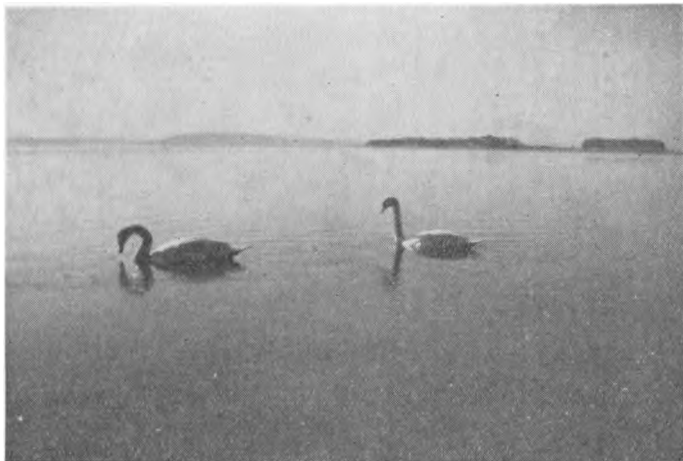
Svaner paa Fjorden.

har vi stadig i Avisen »Gnoti seauton« (Kend dig selv), som blev trykt i et fikst lille Hefte.