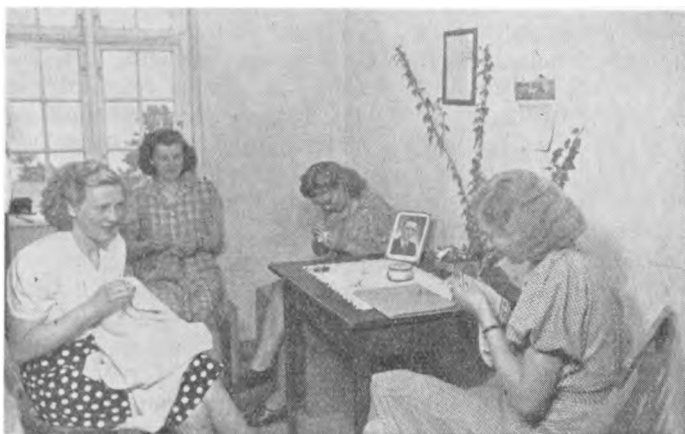
Piger kan altid faa det hyggeligt.