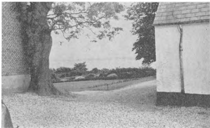
Et skønt Udkig.

Men det stille og rolige Skolearbejde, Aftensamværet i de private Stuer eller i Spisesalen, det trygge og gode Samvær i det hele, det var alligevel det bedste og utvivlsomt ogsaa det, der vil fæstne sig stærkest og varigst i Erindringen. Naar Vinterens tre Skolefester blev saa vellykkede, har det ogsaa sin Baggrund i, at Hverdagens gik saa godt. Kun den, der ogsaa kan arbejde, kan virkelig være med i Festen.