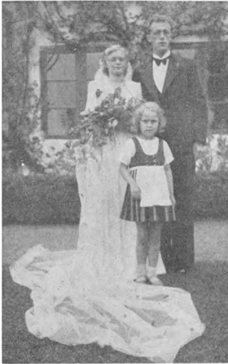
Brudeparret med Brudepige.

og Krog er naturligvis stadig Inspektør og Hoffotograf. Alle vore Hjælpere har den rette Indstilling til Højskolen og dens Gerning.