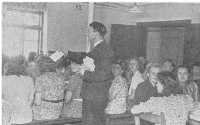
Et af Dagens store Øjeblikke.

med herligt Humør. Det var en dejlig Oplevelse, som vi alle er glade ved at tænke tilbage paa.