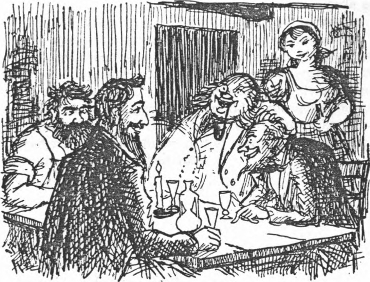
Boye og hans bande holder rådslagning i Sosmedehuset. Heri deltager Boye, Sosmeden, Anders Pranger, Stikirendskrædderen og madam Sosmed.

Som det fremgår af ovennævnte politiprotokol, som kun strækker sig over to år, var forbrydelserne mange, og alle er de uopklaret. Det kan naturligvis ikke siges med sikkerhed, at det er Boyes bande, der står bag dem alle, eller at det er dens medlemmer, som har været på spil, men da flere af de nævnte personer senere bliver dømt ved kommissionsdomstolen, og viser sig at tilhøre Boyes bande, kan man vist roligt gå ud fra, at af de mange nævnte uopklarede tyverier og ildspåsættelser tegner banden sig for de fleste.