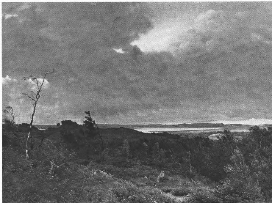
P. C. Skovgaard: Udsigt mod Frederiksværk fra Tisvilde Skov. 1839. Kunstmuseet.