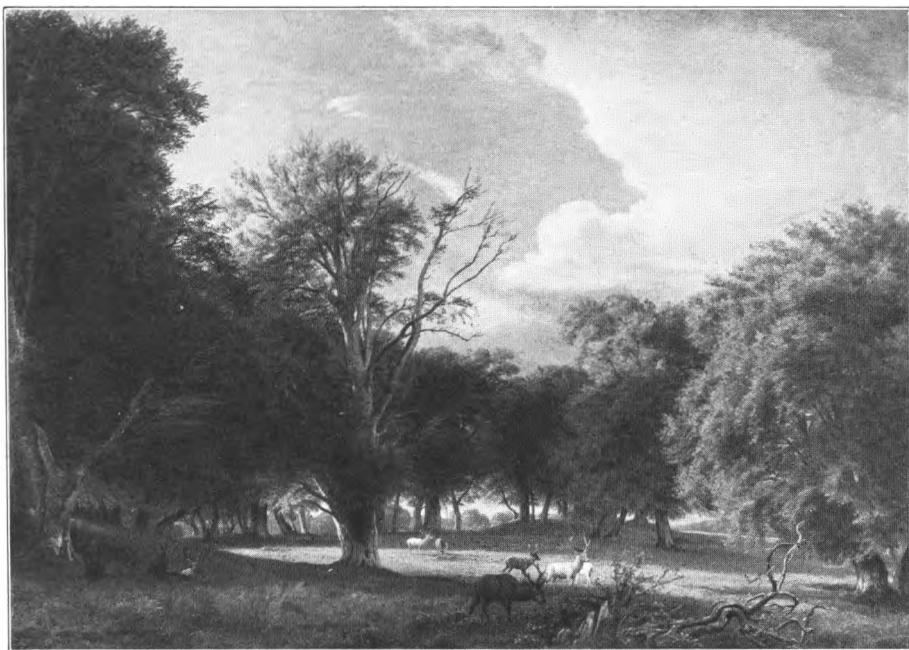
P. C. Skovgaard: Sommereftermiddag med en bortdragende regnbyge. 1862—1874. Kunstmuseet.

P. C. Skovgaard: Sommereftermiddag på malkepladsen ved Knabstrup. 1874—75 (ufuldført).