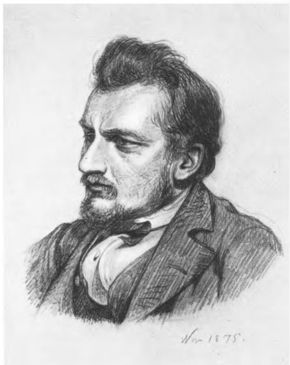
JANUS ANDREAS BARTHOLIN LA COUR Tegning af Joakim Skovgaard (november 1875).

Janus la Cour fødtes 5. september 1837 på Thimgård ved Ringkøbing, men fik sin opvækst i Østjylland. Efter latinskoletiden i Århus tog han 1853 til København og blev Marstrands privatelev. Indtil 1864 gik han på Akademiet. Ved N. L. Høyens formidling blev han fra 1856 nært knyttet til P. C. Skovgaard .