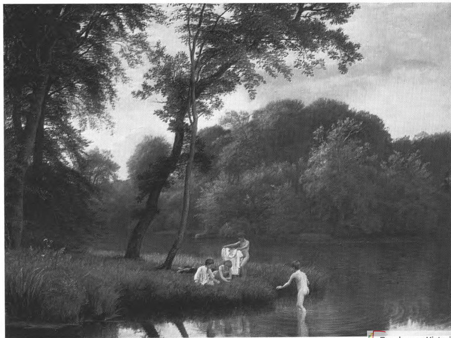
P. C. Skovgaard: En skovsø. Sommeraften. Badende drenge. 1868. Ny Carlsbergfondet.