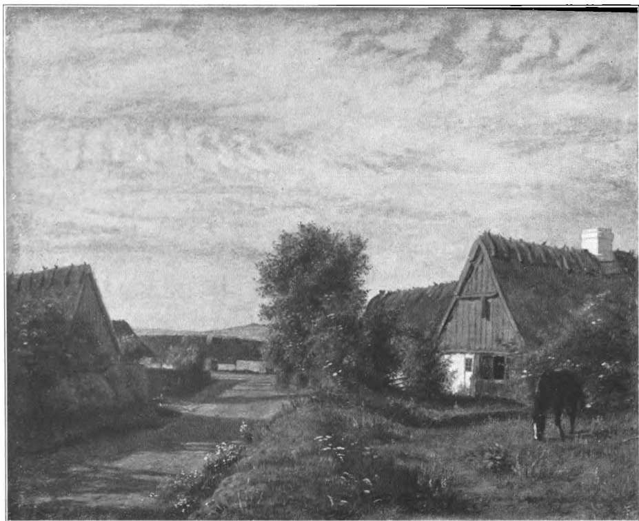
P. C. Skovgaard: Barndomshjemmet i Vejby.