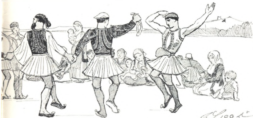
Græske folkedansere. Tegning af Joakim Skovgaard. 1885.

Senere kom jeg i malerlære og på akademiet. 2) På malerlæren tænker jeg altid med glæde, og har sikkerlig haft godt af den