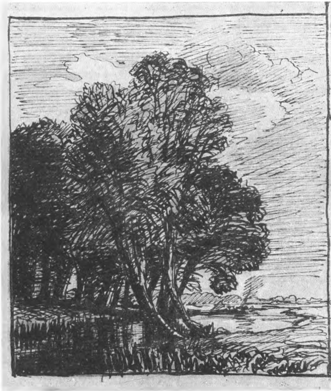
P. C. Skovgaard: Landskabstegning. Kobberstiksamlingen.

ede: »Dette lader folk sig ikke byde nu.« Dette var vel omkring 1870, nu er folk jo vænnet til en del.