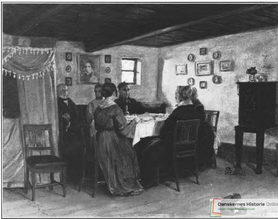
P. C. Skovgaard: Ved thebordet i Vejby. 1843. Kunstmuseet.