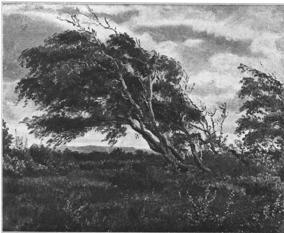
P. C. Skovgaard: Udkanten af Tisvilde Skov. Blæst. 1844.