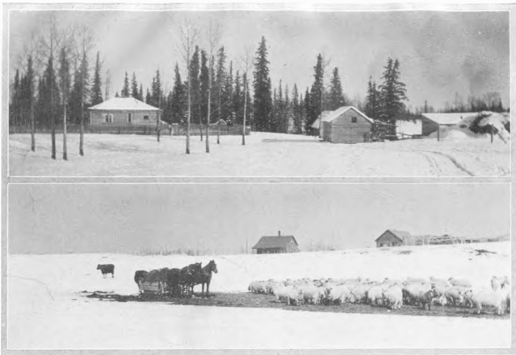
Foroven en dansk Farm ved Kevisville, Alberta; forneden en Faarefarm i Alberta.