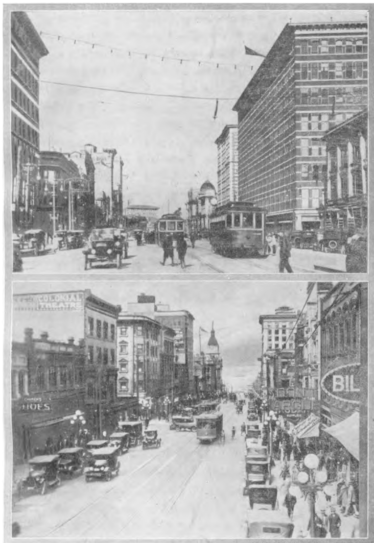
Overst et Gadebillede fra Winnipeg; nederst et Gadebillede fra Vancouver.