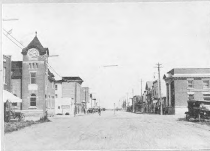
Foroven ses Kirken og Præsteboligen i Standard, Alberta, fornedet et Parti fra LloyDMINSTER.