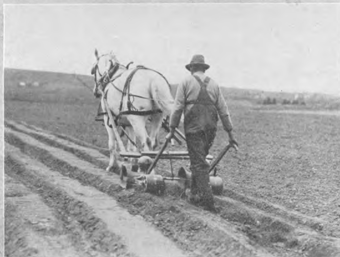
Billeder fra Nova Scotia. Øverst Landskab fra Annapolis dalen, nederst Roerne saas.