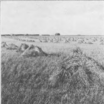
Øverst: Fra Foraarsarbejdet paa en Farm ved Melfort, Saskatchewan. Nederst: Tilvenstre ses Bearspaw „Station“ 14 eng. Mil Nord for Calgary, Alberta; tilhøjre en Hvedemark i Saskatchewan.