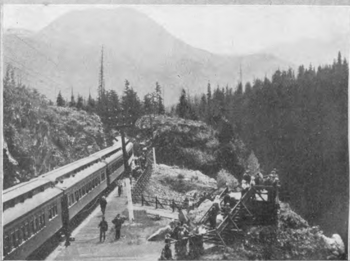
Billeder fra Rocky Mountains (Klippebjergene). En Rejse gennem disse Egne hører til de Oplevelser, man sent glemmer.