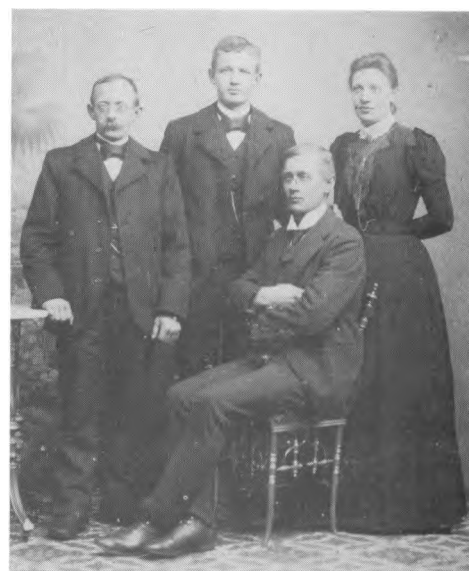
II A - II G - II C - II F