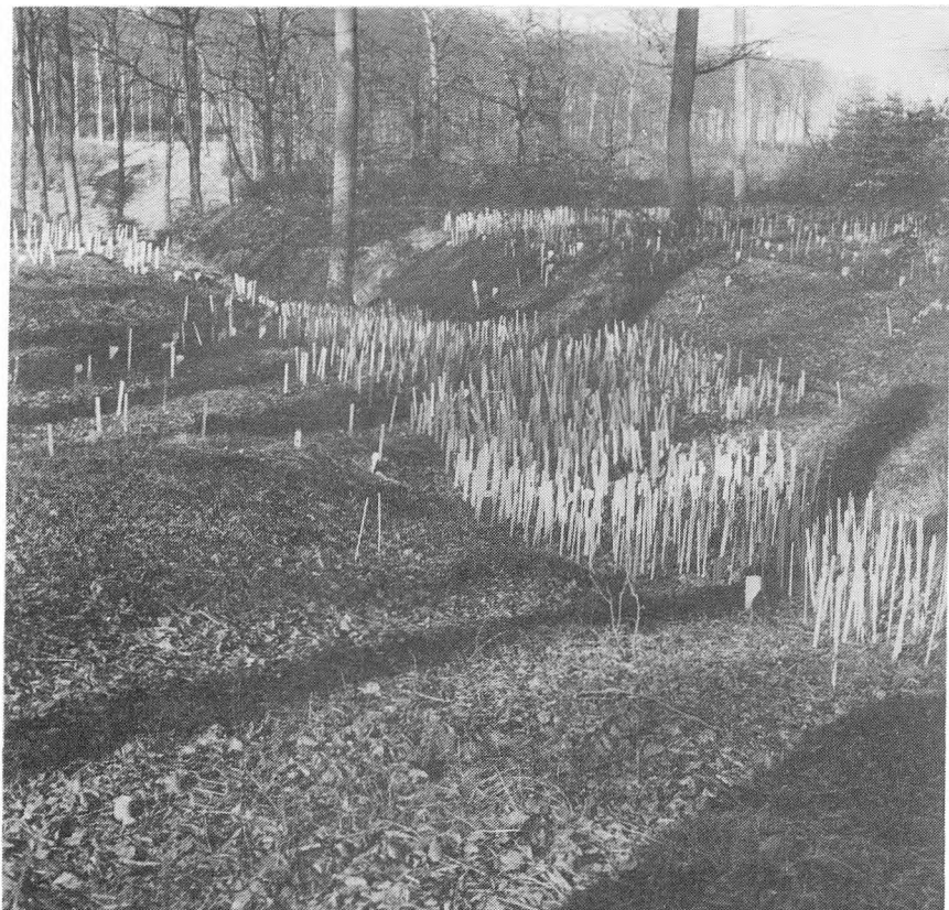
De mange afmærkningspæle i området ved hulvejen nær Hulebækken

taget i de efterfølgende kommentarer, der vil komme ud af en bearbejdning af de enkelte kortblade.