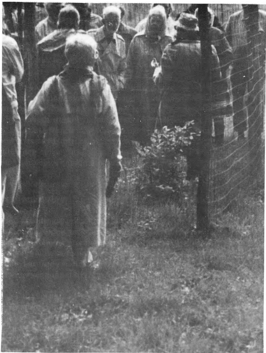
Dansebøgen faldt i 1967, men efter flere forsøg vokser nu en ny, livskraftig Dansebøg op, spiret fra 3 frugter fra det faldne træ og hegnet mod dyrehavens hjorte. Lokalt og officielt, men med rette, bærer den navnet »Steensbergs bøg«.