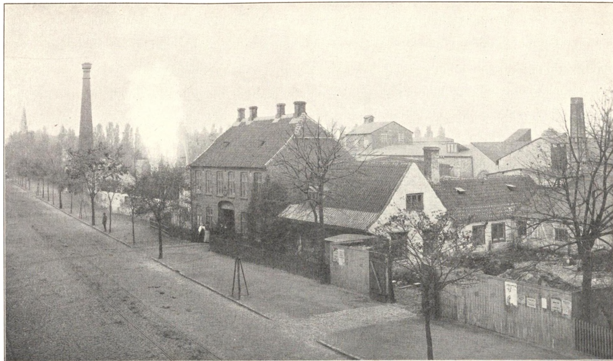
FREDENS MØLLE, AMAGERBROGADE NR. 9