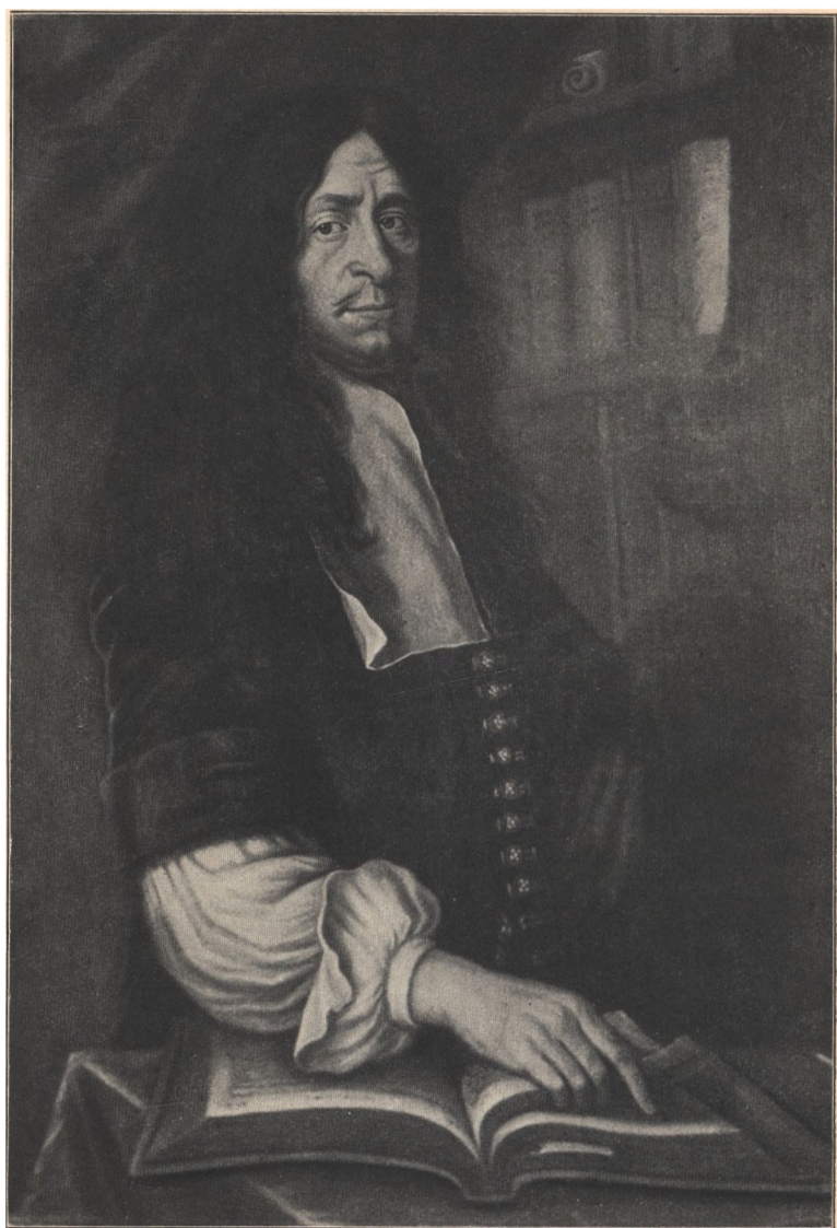
MALERI AF UENDT KUNSTNER (FREDERIKSBORG SLOT).