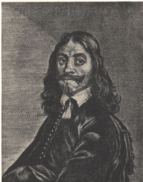
THOMAS BARTHOLINVS, CASP. FIL. D. MED. ET ANATOM. IN ACADEM. HAFNIENSI PROFESS. REGIUS. Etatis 39. A° 1635.

For endnu en Gruppe Stik har van Manders Maleri været Kilde,