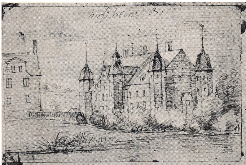
Det hvide Hus, efter skitse i den slesvigske maler Moritz' stambog 1679. Originalen på Det kongelige Bibliotek. Hørsholm Egns Museum 142.

Stuen rummer kun få genstande fra middelalderborgen, hvis beliggenhed er påvist ved udgravninger, der fandt sted i 1941 – se planen på nordvæggen. Ved udgravninger er der fundet mursten og tagsten, og eksempler herpå er udstillet. Af fundamentet blev der i 1959 ved en udgravning syd for Hørsholm Kirke blotlagt en del, der ved borgens nedrivning var væltet ud i den oprindelige voldgrav. Et par af fundamentets kampesten, der er anbragt ved indkørselen til parkeringspladsen øst for kirken, bærer spor af „den uforgængelige“, middelalderlige kalkmørtel. I den vestlige del af kirkeøen blev der