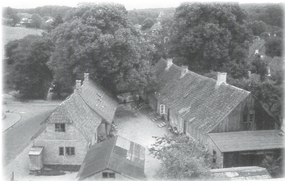
Suhmsminde fotograferet i slutningen af 1950'erne af J.Gørløv

Vi startede i en 1-værelses lejlighed. Væggene var lerklinede. Der var das i gården, og kun koldt vand inde. Vi fyrede med alt muligt vi kunne få fat i. Der var en stor åben skorsten midt i køkkenet. Der havde jeg fået den smarte ide at stille et spisebord. Så blev det heldigvis regnvejr inden vi flyttede ind, og soden løb fra skorstenen og ud i køkkenet. Så den fik vi muret til.