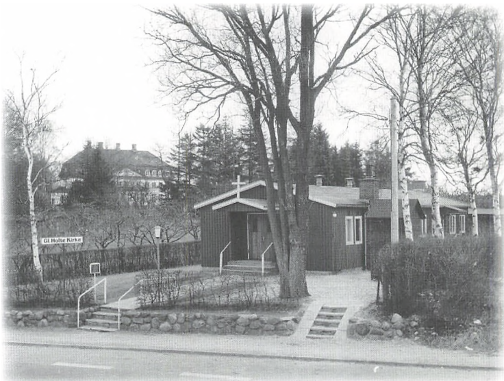
Guds lille sommerhus 1965.

I forbindelse med kirkebyggeriet måtte det lille skovløberhus på Kohavevej fjernes, og der blev anlagt en ny vej, Langhaven.