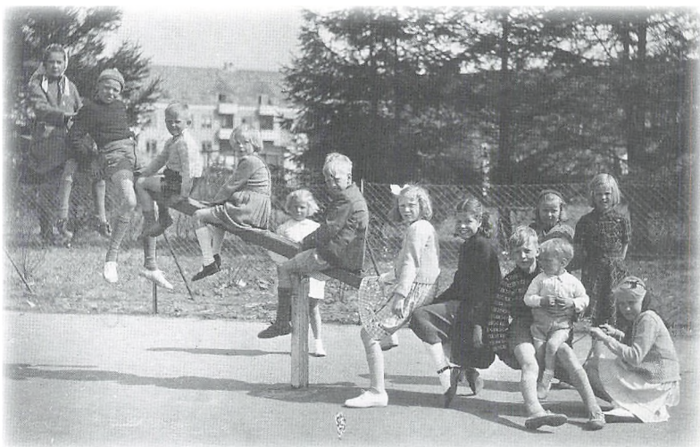
Børn på legepladsen. Billederne er taget af "kanonfotograf" Carl Riemann, som har solgt billederne til børnenes forældre.

Den største "trussel" var Tølbøl fra Holtegård. Han lå på lur for at fange os, når vi havde bygget huler i kornet, og det gjaldt om at spæne for ikke at blive fanget af ham. Pige hjemmet, der lå ved siden af marken og skoven, var også forbudt område. Der gik rygter om pigerne, og da de også gik på Gl. Holte skole, kunne vi jo ved selvsyn se og høre på deres historier, at der var god grund til at de boede bag lås og slå.