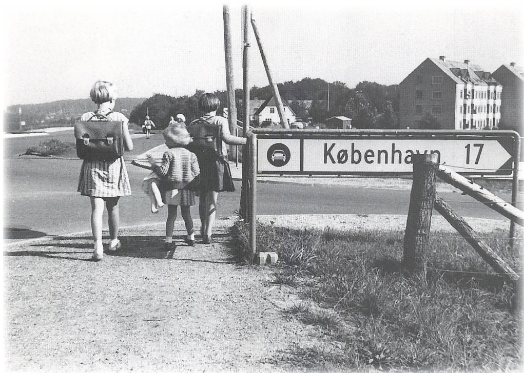
På vej hjem fra Gl. Holte Skole - 1952.

Flere af forretningerne overlever stadig, på trods af de store supermarkeds kæder i Holte og Trørød. Specielt for de ældre er det dejligt at have en købmand i nær- området.