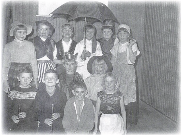
Fastelavn i selskabslokalerne 1961

Om eftermiddagen var vi ude og rasle. Som regel gik vi 3-4 sammen. Det må have kostet mange én- og toører, for der var jo mange børn i Skoleparken, og jeg kan ikke huske, at vi gik forgæves.