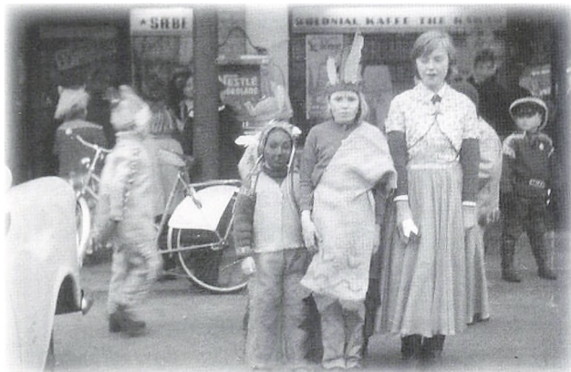
Udklædte børn foran forretningerne 1963