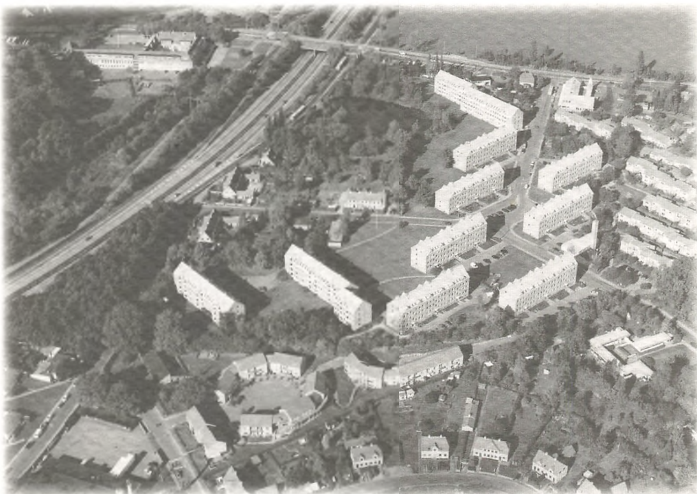
Luftfoto af Skoleparken - Gl. Holte