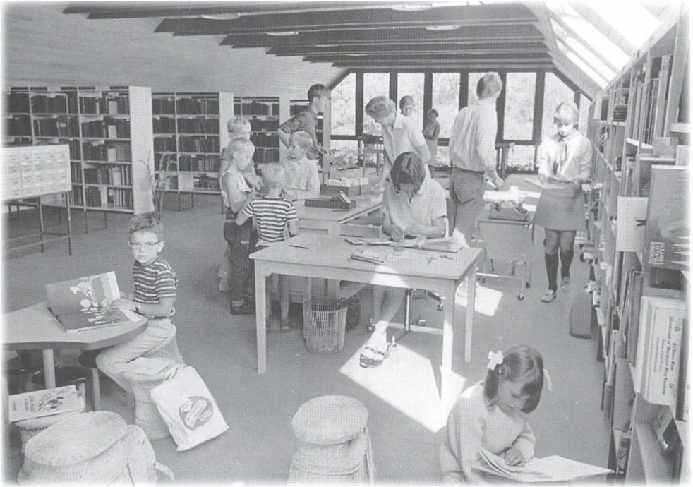
Interiør fra biblioteket 1968.

Befolkningsunderlaget var på 6 000, heraf 2 000 fra Trørød. Mange kom fra Skoleparken, der var to døgninstitutioner i området, samt fru Flatau's skovbørnehave, der var flittige brugere. . . .