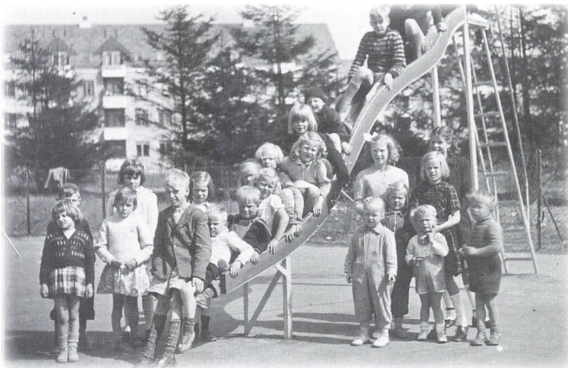
Børn på legepladsen ca. 1953

Vi var altid ude - man legede ikke indendørs. Og hvis vejret var meget dårligt, tog vi opgangen og kælderens i brug. Den var varm, og der var gamle cykler og barnevogne, hvor vi indrettede små huler.