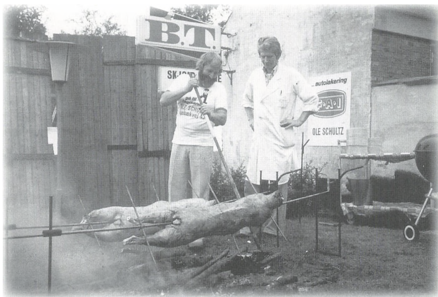
Grillning af lam sensommer 1979

Noget af det forretningen blev mest kendt for, var islandske lam og vildt. Det var ikke så almindeligt at spise lam dengang, og det var heller ikke så dyrt. For at få folk til at spise lam, havde vi flere lørdage nogle store grill stående ude på fortovet, hvor vi grillede, og så fik folk smagsprøver. Det gik strygende.