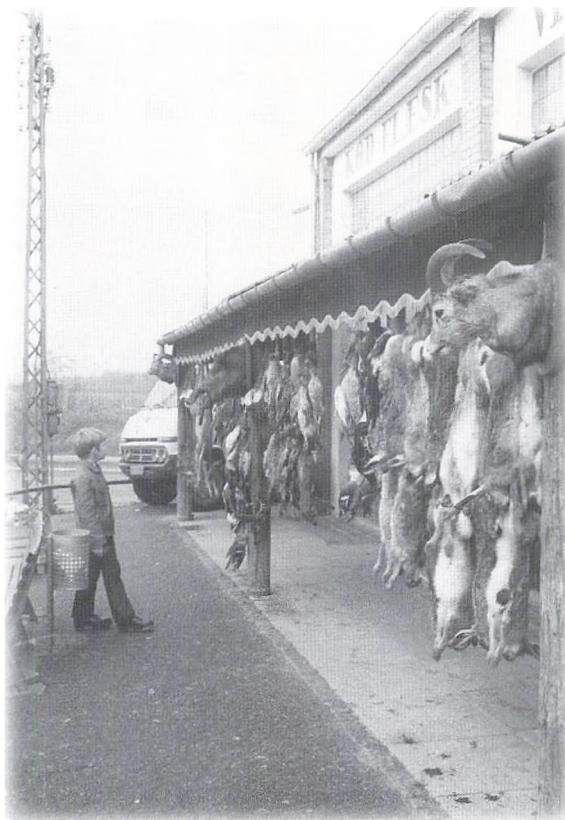
Vildt foran forretningen efterår 1986.

Efter lukningen har der ikke været drevet slagterforretning i Gl. Holte. Nu må kunderne til Holte.