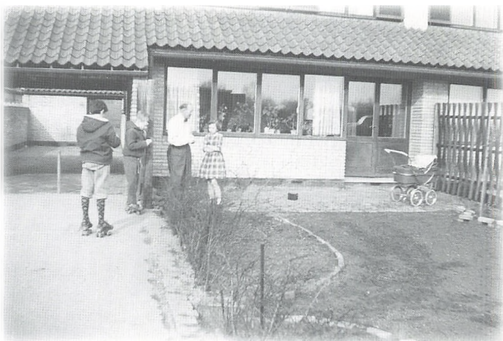
Familien Tinning på Malmbergsvej 73 - Forord 1960.

Fra vi flyttede ind i 1960, og til han holdt op, passede Madsen alt det grønne i området. Han klippede alle hækkene to gange om året – forår og efterår – og det skete ved håndkraft (hækkesaks). Han skuffede alle grusgangene, rev affaldet sammen og kørte det væk i trillebør. Om efteråret blev der fejret blade over det hele, og det var et stort område, rækkehusene og de flade hvide på den anden side af Malmbergsvej, og de hvide enkelthuse oppe ved motorvejen.