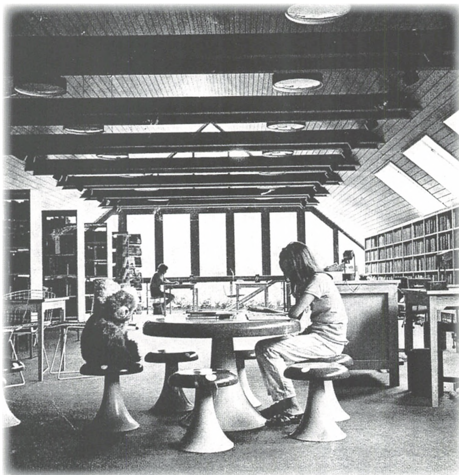
Møblerindretning fra biblioteket.

Det var et dejligt lokale på 200 kvadratmeter, vinduesparti i hele gavlen og arkitekttegnede reoler og møbler. Det var opdelt i et læsehjørne med aviser og tidsskrifter og en lille håndbogssamling, en voksenafdeling med skøn-og faglitteratur - og sidst, men ikke mindst en meget brugt børneafdeling. Bogsamlingen var ikke stor, men tilpasset behovet, og der var daglig transportforbindelse til hovedbiblioteket.