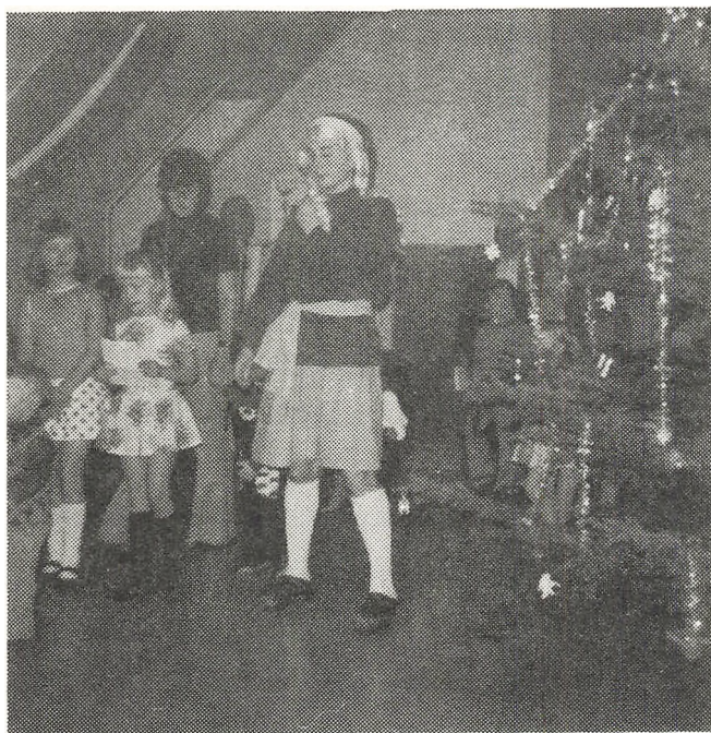
Glimt fra juletræsfesten

Bladet vil til gengæld være lidt mere omfangsrigt end sædvanligt, idet vi gerne vil fortælle om de arrangementer, klubben har afholdt siden sidste nr. af bladet udkom.