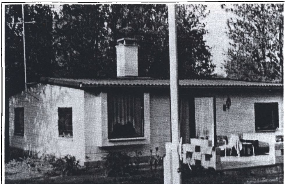
I 1969 byggede familien Hervø nyt sommerhus på Korsbjergvej 13. Her ses det i 1970.

og vi ville gerne have, at området blev kloakeret, så vi kunne komme videre, men det var der andre, der ikke ville. Da inddelingen i by- og landzoner kom, blev vores område placeret i landzone, og så var det slut med drømmen. Naboen nåede dog lige at bygge sig et rigtigt hus inden stoppet kom. Det skete, så vidt jeg husker, omtrent samtidig med, at kasernen kom. Min mand var skuffet, men jeg kunne nu fortsat godt lide at have den grund, hvor vi tog ud om sommeren.